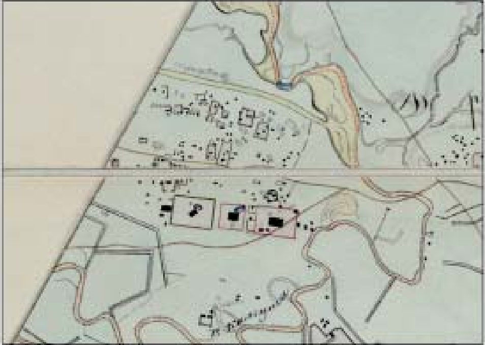
Рис. 3. «Северо-западный» пригород Царевского городища и район «ханских мавзолеев» (фрагмент малого плана Н.К. Тетеревникова)