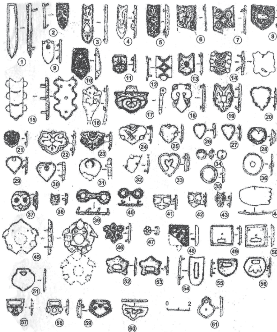
Рис. 2. Мордовские аналогии украшениям волжских болгар (по В.А. Винничеку В.П. Лебедеву)