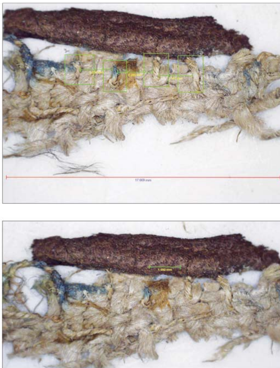
Рис. 4. Структура ткани на подкладке металлической пластины.