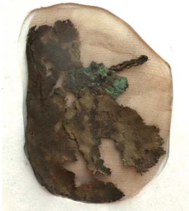
Рис. 8. Кожаный фрагмент с наклейки после консервации.