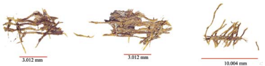
Рис. 5. Волокна шелка.