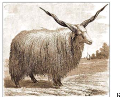
Рис. 2. А – микроснимок образца кожи от сумочки из погр. 8 Красногорского могильника; Б – фото овцы породы «racka»; В – эталонный образец мерей овцы породы «racka».