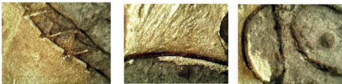
Рис. 7. Микроснимки фрагментов лицевой стороны накладки.