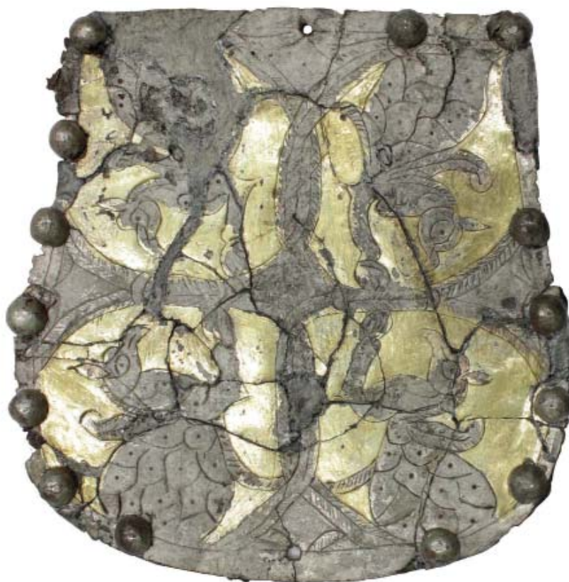
Рис. 6. Металлическая пластина на крышке кошелька из погр. 8 Красногорского могильника.