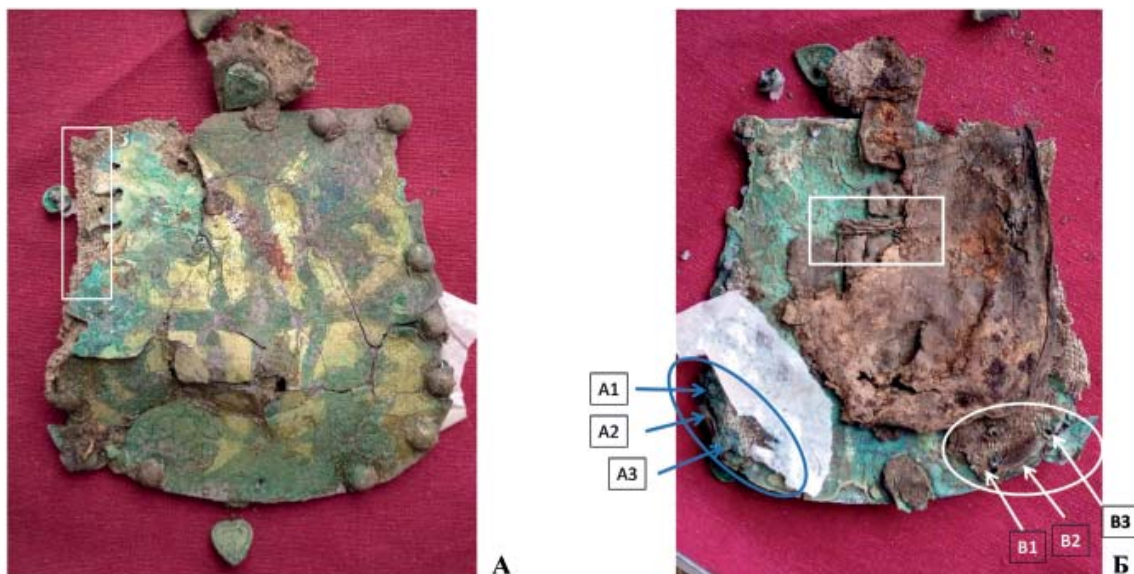
Рис. 1. Первоначальный вид накладки из погребения 8 Красногорского могильника. А – лицевая сторона; Б – обратная сторона.