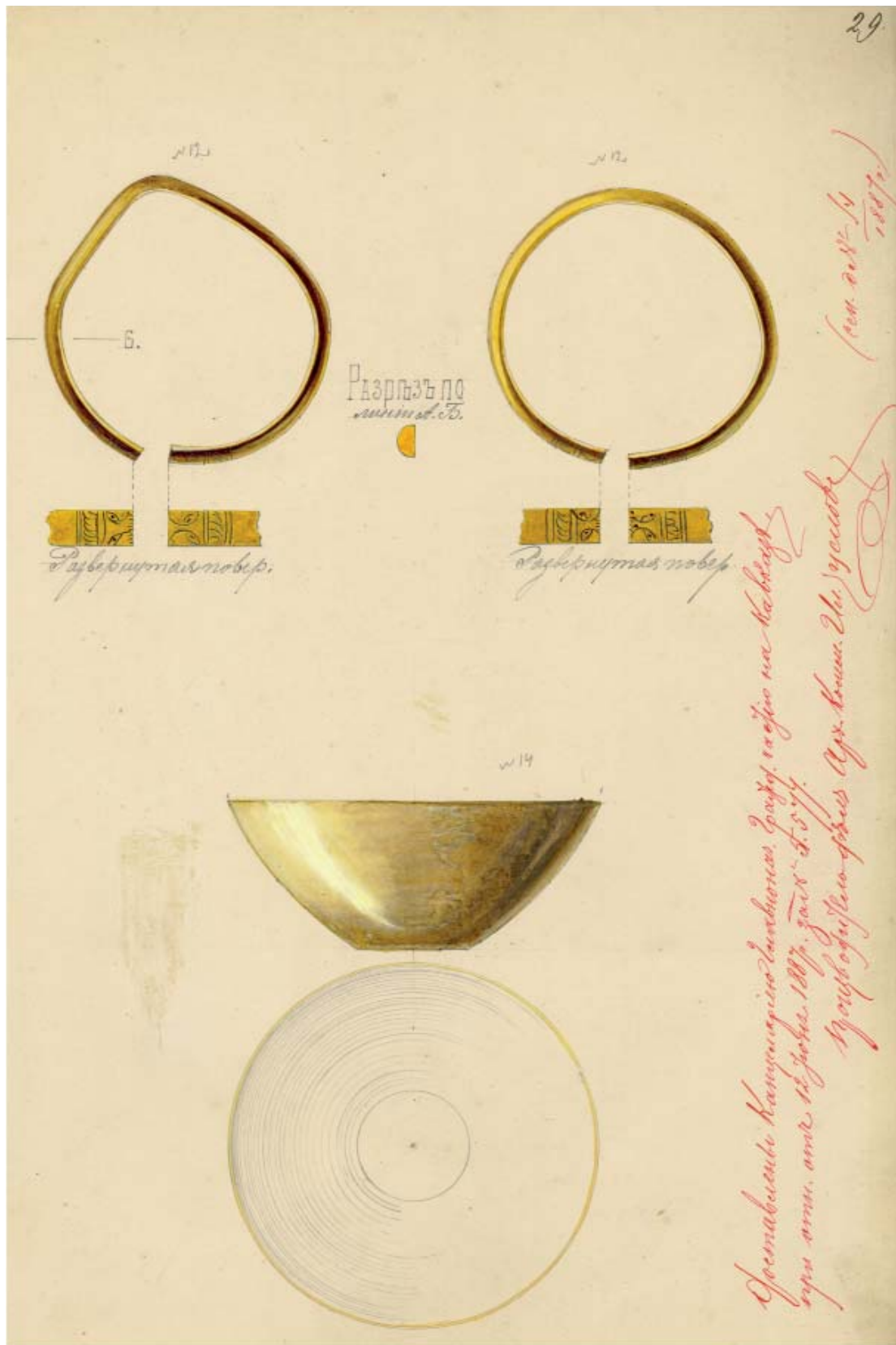
Рис. 2. Юн-баба-1887: 12 – браслеты золотые, 2 шт.; 14 – чаша золотая (Научный архив ИИМК, ф. 1, д. 1887, л. 29).

Fig. 2. Yun-baba-1887: 12 – golden bracelets, 2 pcs.; 14 – golden bowl. The drawing has been reduced by 2 times compared to the original (ИИМК Scientific Archive, f. 1, d. 1887, l. 29).