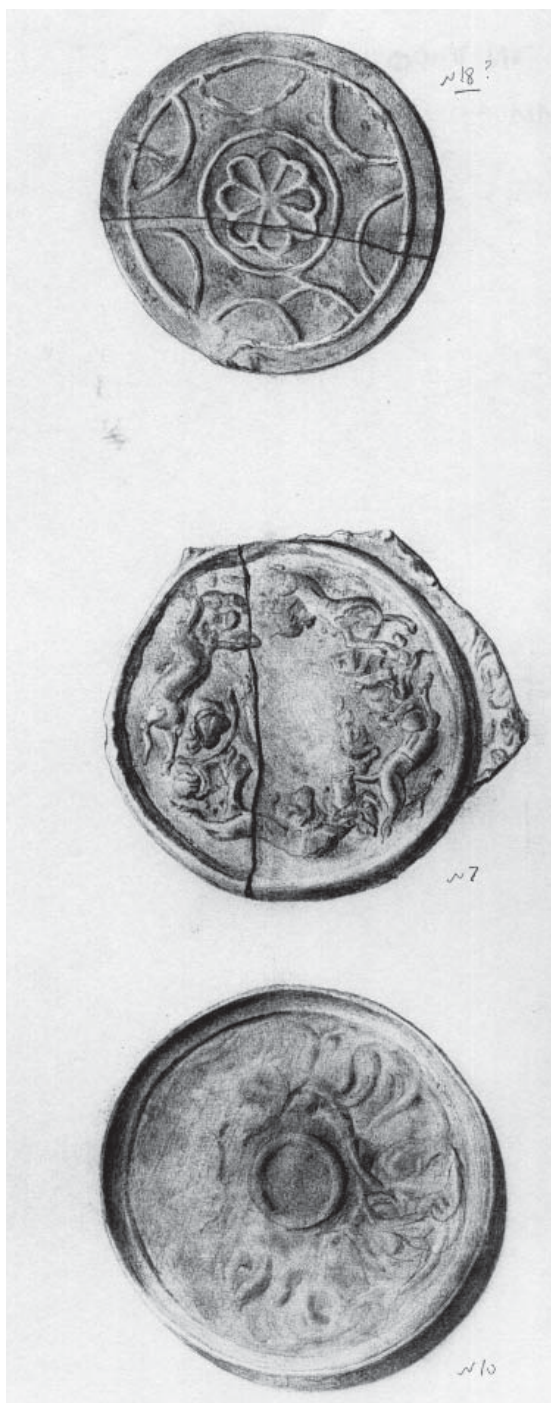
Рис. 5. Бронзовые зеркала. 18 – курган на горе Юн-баба 1887 г.; 7 – Рагули -1887б; 10 – Бешпагирское-1887 (Научный архив ИИМК, ф. 1, д. 1887, л. 25).

Fig. 5. Bronze mirrors. 18 – the burial mound on Yun-Baba Mountain in 1887; 7 – Raguli -1887b; 10 – Beshpagirskoe-1887 (Scientific Archive of the Institute for Material Culture History, f. 1, d. 1887, l. 25).