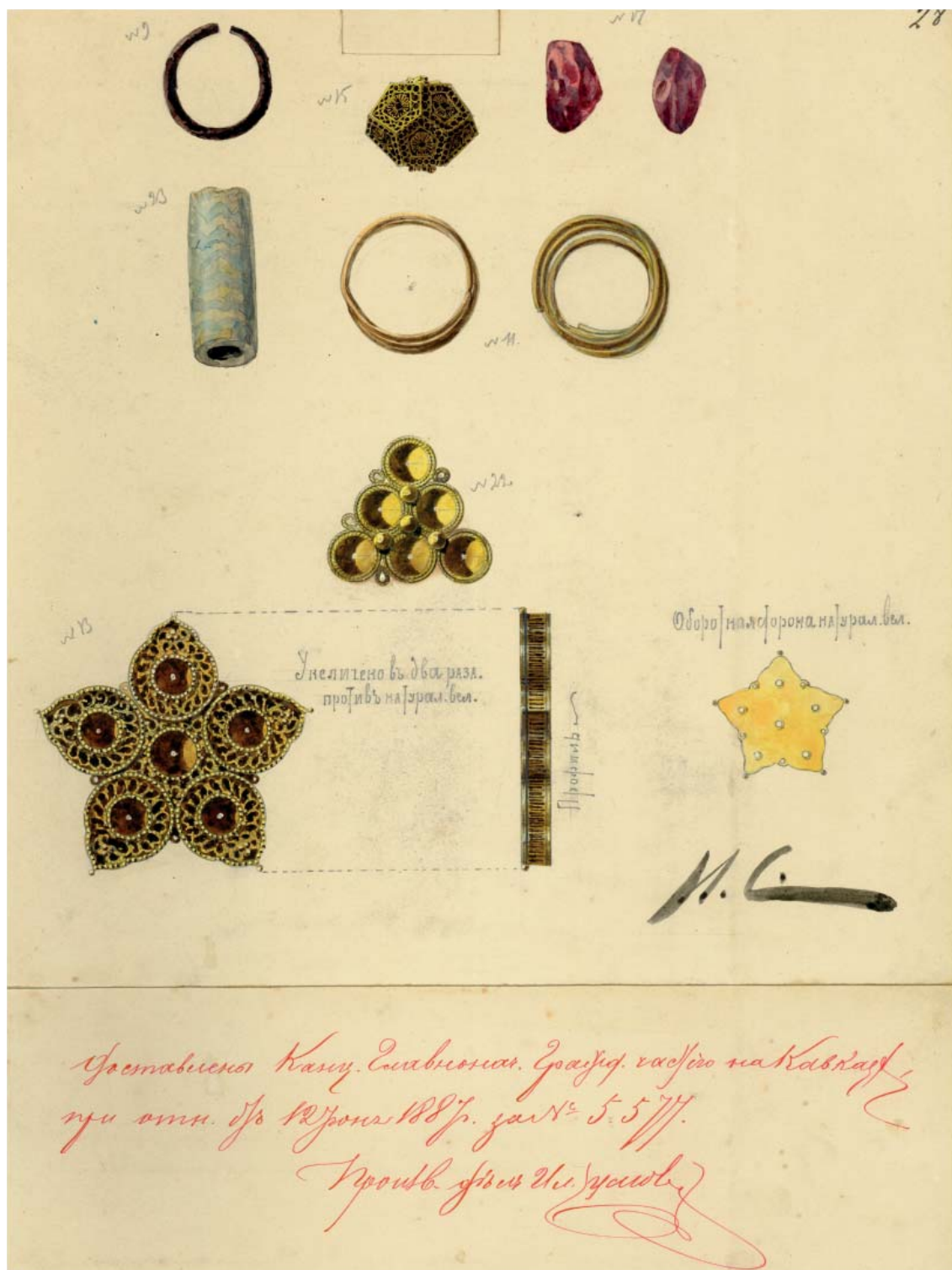
Рис. 3. Юн-баба-1887: 13 – бляшка-розетка; 15 – сканое украшение; 17 – пронизи из аметиста, 2 шт.; 22 – золотая бляшка; 23 – подвеска стеклянная. Отдельные находки: 9 – Рагули -1887б, серьга бронзовая; 11 – Здвиженское-1887, 11 – подвески золотые, 2 шт. (Научный архив ИИМК, ф. 1, д. 1887, л. 28).

Fig. 3. Yun-baba-1887: 13 – rosette plaque; 15 – jewelry; 17 – amethyst piercing, 2 pcs.; 22 – gold plaque; 23 – glass suspension. Individual finds: 9 – Raguli -1887b, bronze earring; 11 – Zdvizhenskoye-1887, 11 – golden pendants, 2 pcs. (Scientific Archive of the Institute for Material Culture History, f. 1, d. 1887, l. 28).