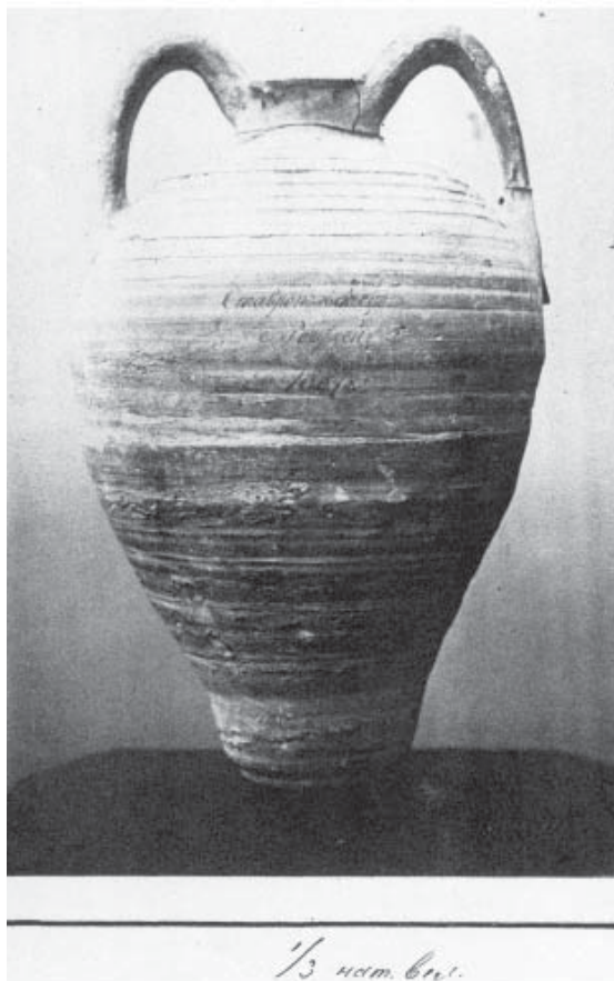
Рис. 4. Рагули -1886/1887а – амфоровидный сосуд (Научный архив ИИМК, ф. 1, д. 1887, л. 27).

Fig. 4. Raguli -1886/1887a – an amphoroid vessel (Scientific Archive of the Institute for Material Culture History, f. 1, d. 1887, l. 27).