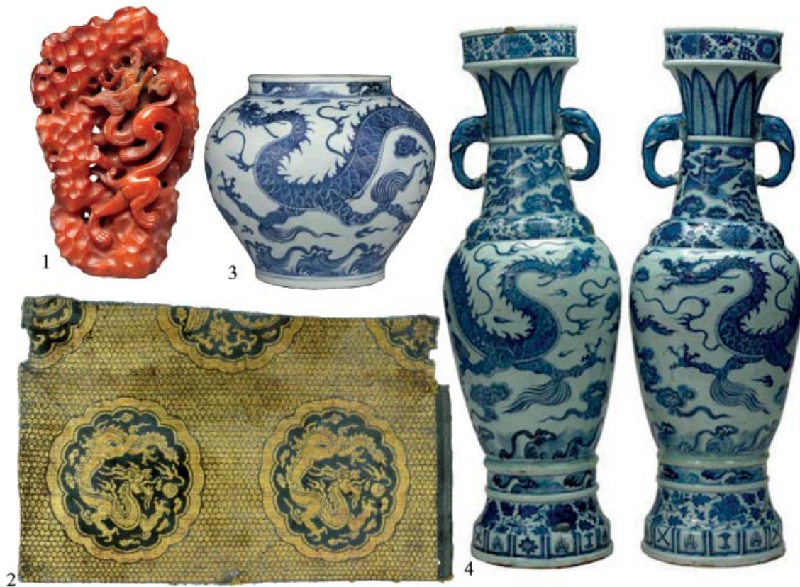
Рис. 3. Изображение дракона в произведениях декоративно-прикладного искусства династии Юань. 1 – дракон, карабкающийся по скале, XIV в.. Metropolitan Museum, accession number: 2018.151 без масштаба; 2 – фрагмент ткани с изображением драконов, играющих огненной жемчужиной, XIII–XIV вв., Metropolitan Museum, accession number: 2012.399 без масштаба; 3 – бело-синяя ваза с изображением дракона, 1279-1368. Idemitsu Museum, Tokyo ; 4 – the David Vases, 1351 г, Yuan dynasty, 63.6 x 20.7 cm, Jiangxi province, China без масштаба.

Fig. 3. The image of a dragon in the works of decorative and applied art of the Yuan Dynasty. 1 – a dragon climbing a cliff, 14th century; 2 – the textile fragment with dragons images, playing with flamy pearls; 3 – blue and white vase with the image of a dragon, 1279-1368; 4 – The David Vases , 1351 г, Yuan dynasty.