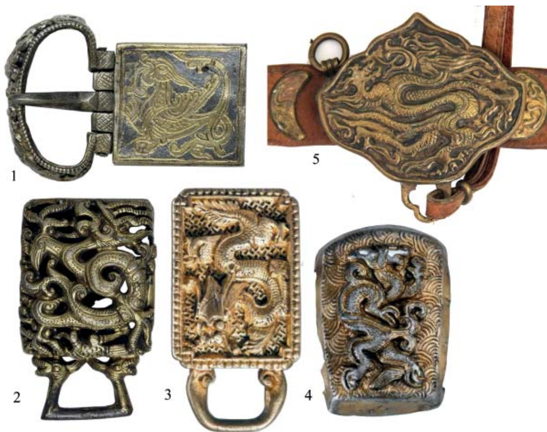
Рис. 2. Изображение дракона в произведениях торевтики Золотой Орды. 1 – пряжка с изображением дракона, Красноярское городище, Астрахань. ГЭ, инв. № 30 – 762 (фото) без масштаба; 2 – обоймица с изображением дракона, Красноярское городище, Астрахань. ГЭ, Инв. № 30 – 762 (фото); 3 – накладка на пояс с изображением дракона, XIII – XIV вв. Приобретено в Бухаре. ГЭ, инв. № СА – 12964 без масштаба; 4 – накладка на пояс с изображением дракона, XIII–XIV вв. ГЭ, инв. № СКи 877, 880-882, 884, 727, 728, 739, 741 без масштаба; 5 – бляха-пронизь с рельефным изображением дракона, XIV в., реконструкция. Ставропольский государственный историко-культурный и природно-ландшафтный музей заповедник им. Г.Н. Прозрителева и Г.К. Пправе, без масштаба.