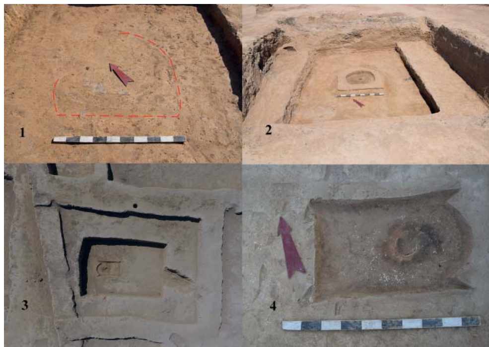
Рис. 4. 1 – контуры очага-алтаря; 2 – прямоугольное культовое помещение № 9; 3 – прямоугольное культовое помещение № 10; 4 – очаг-алтарь в помещении № 10.