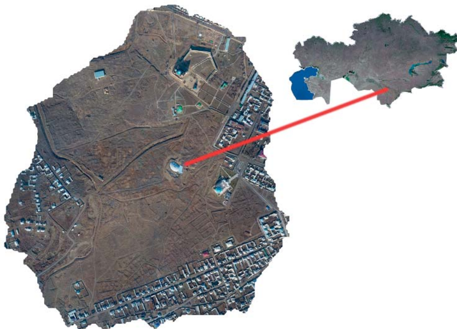
Рис. 1. Ортофотоплан городища Культобе.