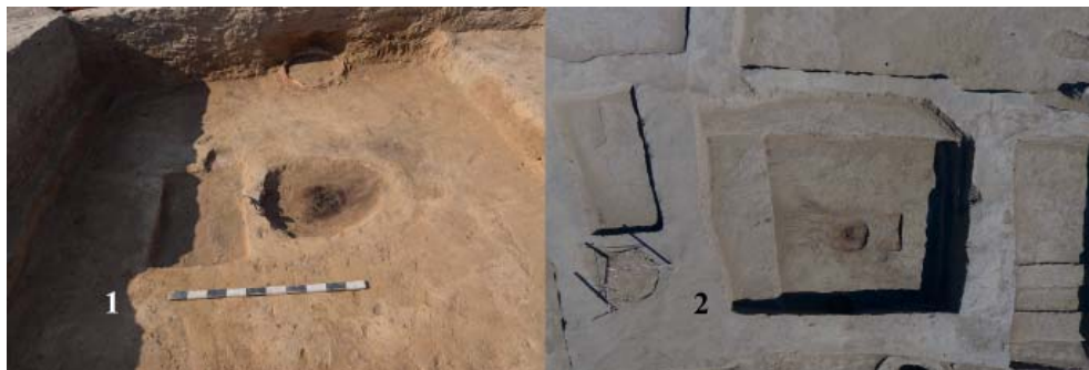
Рис. 5. 1 – очаг-алтарь в помещении № 15; 2 – прямоугольное культовое помещение № 15.