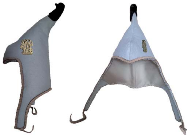
Рис. 4. Реконструкция способа использования золотой пластины для декорирования головного убора.