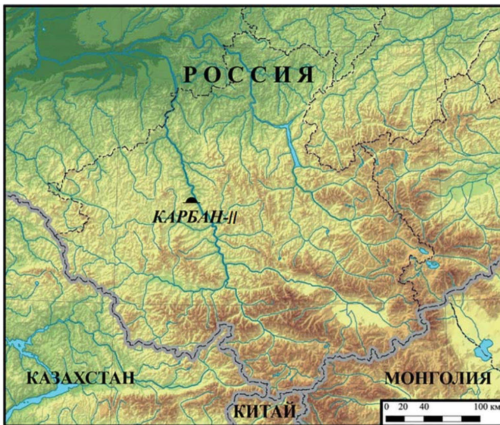
Рис. 1. Месторасположение могильника Карбан-2 на карте-схеме Республики Алтай.