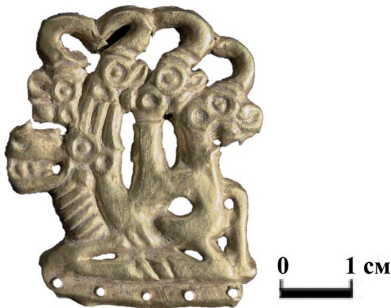
Рис. 3. Золотая пластина с изображением синкретического существа из кургана № 2 могильника Карбан-2.