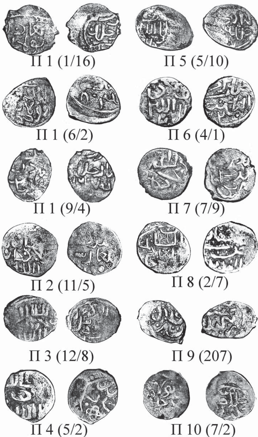
Рис. 1. Монеты Пулада (Булата) из Измерского клада Fig. 1. Coins of Pulad (Bulat) from the Izmer treasure