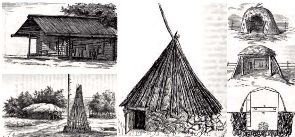
Рис. 1. Реконструкция жилища по Heikel A.O. Fig. 1. Reconstruction of a dwelling after Heikel A. O.

стью переписан, при этом фактология оставлена без изменений) вышли отдельным изданием (Миллер, 1791) (рис. 2: б–в). В структурном отношении исследование состоит из восьми глав, одна из которых посвящена жилым сооружениям. С помощью нескольких гидронимов и топонимов Г.Ф. Миллер отмечает: «...Множество находящихся в сих местах лесов есть ... причиною, что все вышеупомянутые народы жилища имеют или в лесах, и к поселению своему выбирали такие места, что каждая деревня построена при нарочитой реке, или речке, или озере...» (Миллер, 1791, с. 36).