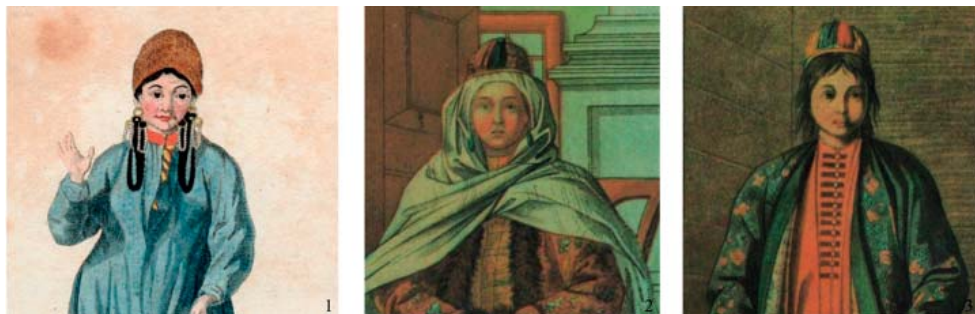
Рис. 4. Женские головные уборы сибирских татар в конце XVIII – начале XIX в. 1 – чатская татарка (по: Георги, 1799, рис. 29), 2, 3 – томские татарки (по: Мухамедова, 1997, рис. 49, 51).