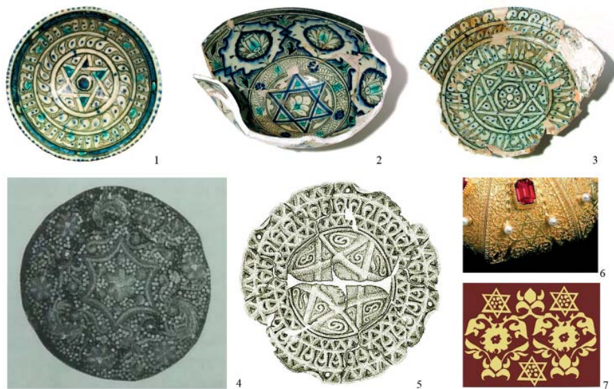
Рис. 3. Мотив шестилучевой звезды в искусстве Золотой Орды и поволжских татар. 1, 2, 3 – золотоордынские чаши с полихромной росписью. Нижнее Поволжье. XIV в. (По: Лисова, 2012, рис. 51, 65, 74); 4 – татарский головной убор. Поволжье. XIX в. (по: Сусллова, Мухамедова, 2000, с. 71); 5 – реконструированное украшение головного убора из могильника Шайтан-II; 6 – детали украшений Шапки Мономаха; 7 – реконструкция узора на парчовой ткани шапочки-бокки. Нижнее Поволжье. XIII–XIV вв. (по: Кубанкин, 2006, рис. 3, 13).