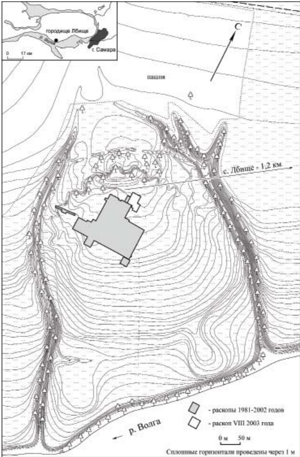
Рис. 1. План городища Лбище.