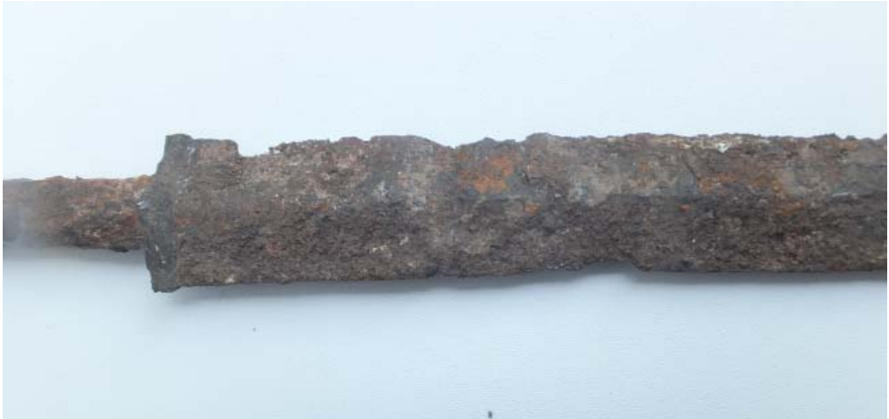
Рис. 3. Верхняя половина клинка и перекрестие. Fig. 3. The upper part of the blade and the guard.