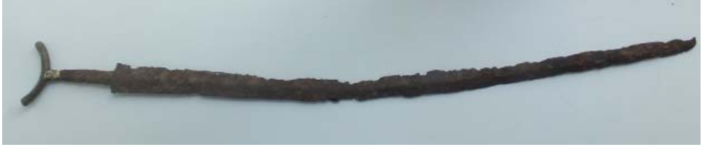
Рис. 2. Общий вид меча. Fig. 2. General view of the sword.