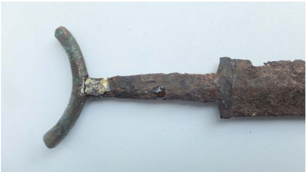
Рис. 4. Навершие меча. Fig. 4. Pommel.