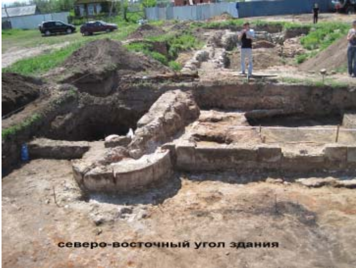
Рис. 5 (а)