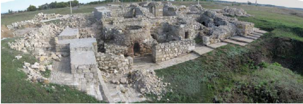
Рис. 6. «Белая Палата».

орудия производства из кости, стекла, гипса, цветного металла. О торговом назначении исследуемого комплекса свидетельствуют и находки практически в каждом сооружении разновесов и деталей весов. Вне всякого сомнения, этот комплекс остается одним из наиболее привлекательных объектов археологического изучения. На сегодня раскопами исследовано более 1000 кв. м, что составляет примерно 2/3 предполагаемой площади вскрытия (Баранов и др., 2012, с. 160; Коваль, 2013, с. 9).