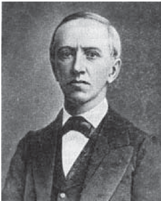
Рис. 1. (а). Портрет В.Г. Тизенгаузена