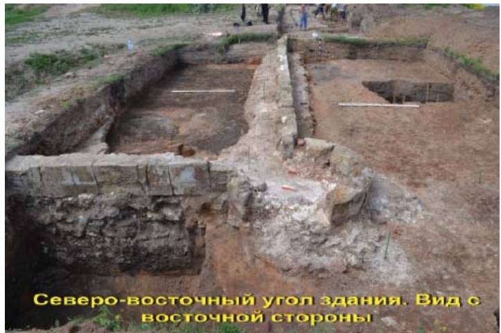
Рис. 5 (б)