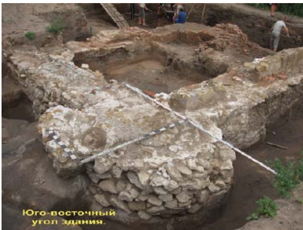
Рис. 5 (в)