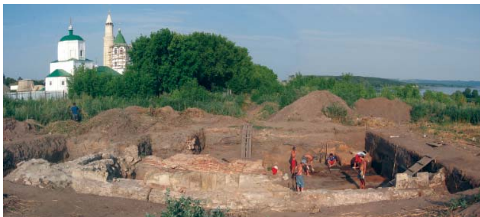
Рис. 4. Общий вид раскопа «Дом с башнями».