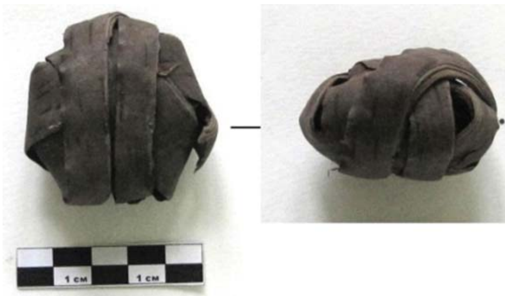
Рис. 8. Заготовка берестяной ленты (Свияжск).