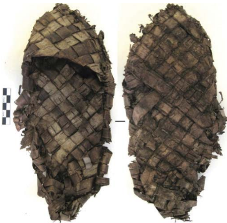
Рис. 7. Лапоть из бересты (Свияжск).