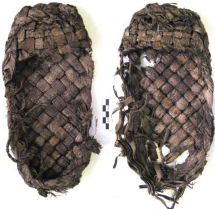
Рис. 4. Пара лыковых лаптей (Казань), после реставрации.