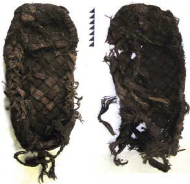
Рис. 6. Пара лыковых лаптей (Казань), до реставрации.