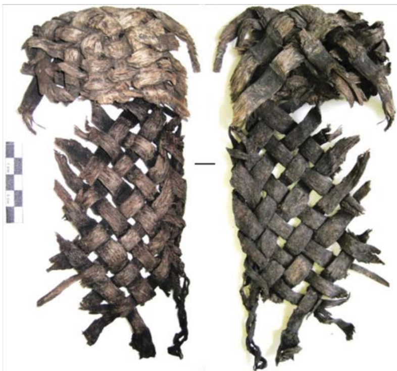
Рис. 5. Лыковый лапоть (Свияжск).