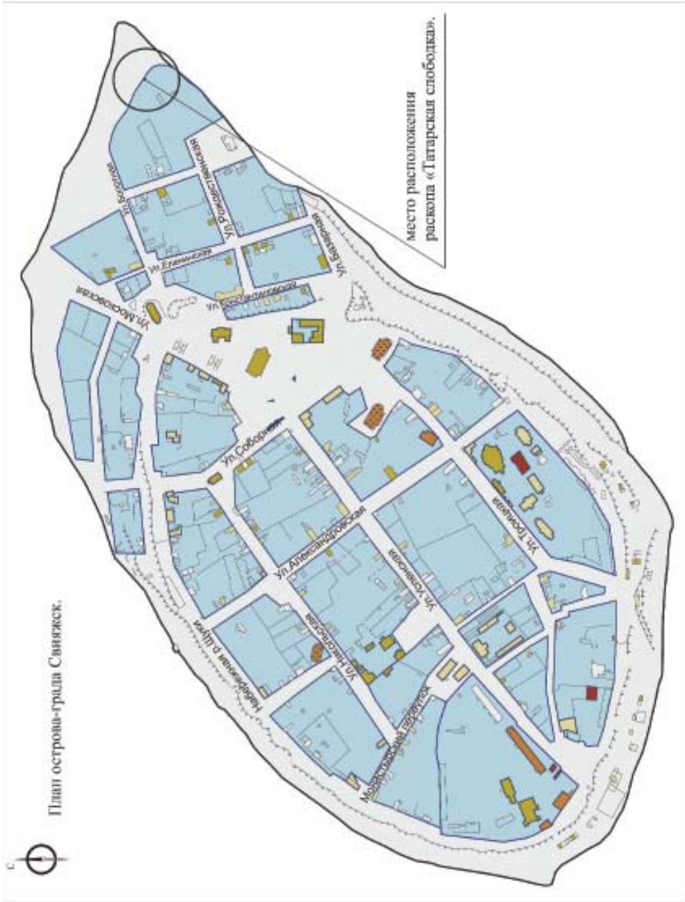
Рис. 1. План острова Свияжска с указанием места раскопок.