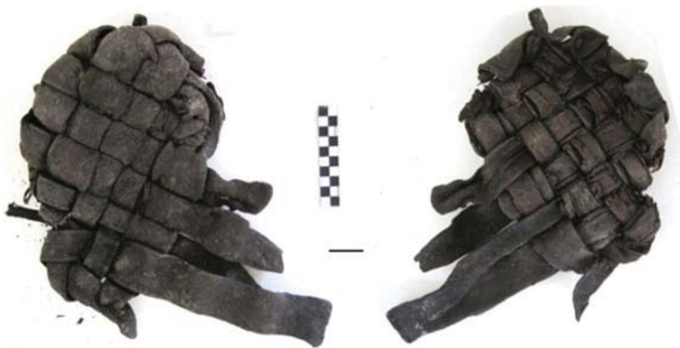
Рис. 9. Фрагмент кожаного лаптя (Свияжск).