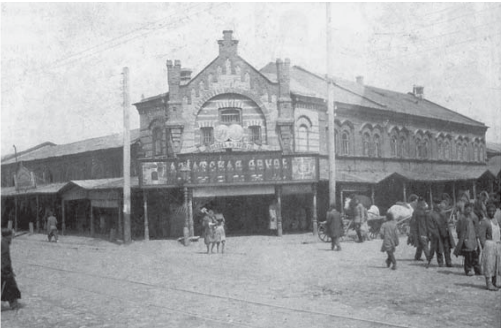
Рис. 3. Фото дома Усманова (Казань, конец XIX века).