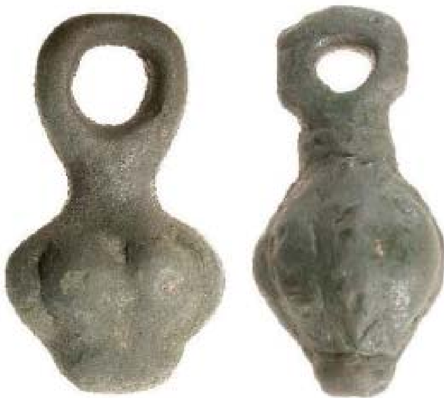
Рис. 5. Кистени «куманского типа» из Северо-Восточной Болгарии, XII в. (Региональный исторический музей, г. Варна).