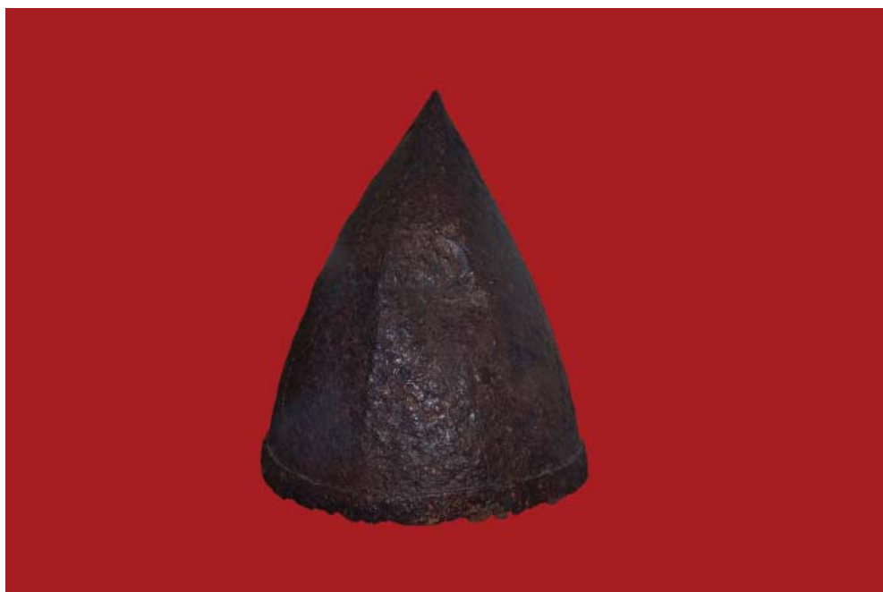
Рис. 7. Серьги в виде знака вопроса и шлем из могильника средневекового Перника, XII–XIII вв. (Региональный исторический музей, Перник).