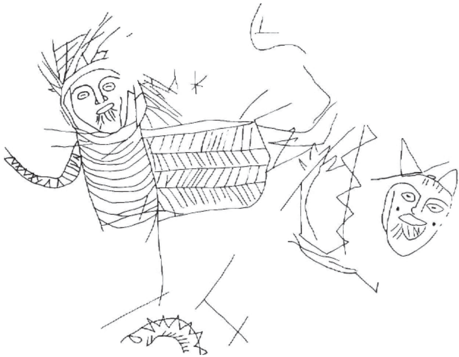
Рис. 6. Изображение шамана на сосуде из Велико Тырнова – вид и графическая реконструкция (см. Алексиев, 1989, с. 441, обр. 1; с. 447, обр. 2).