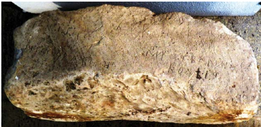
Рис. 3. Каменная надпись из Преслава, повествующая о куманях (Археологический музей, Велики Преслав).