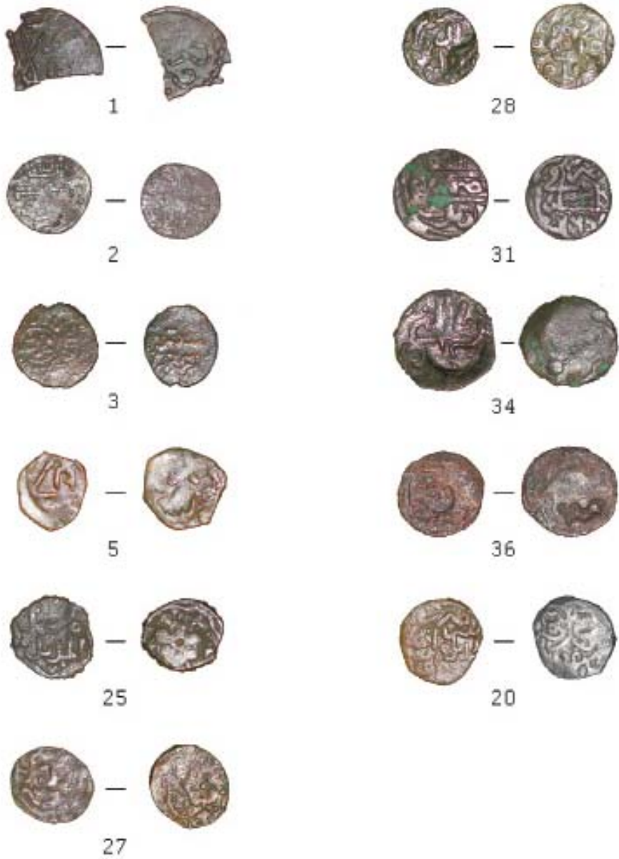
Рис. 1. Фототаблица (номера монет из фототаблицы соответствуют номерам из таблицы 1)