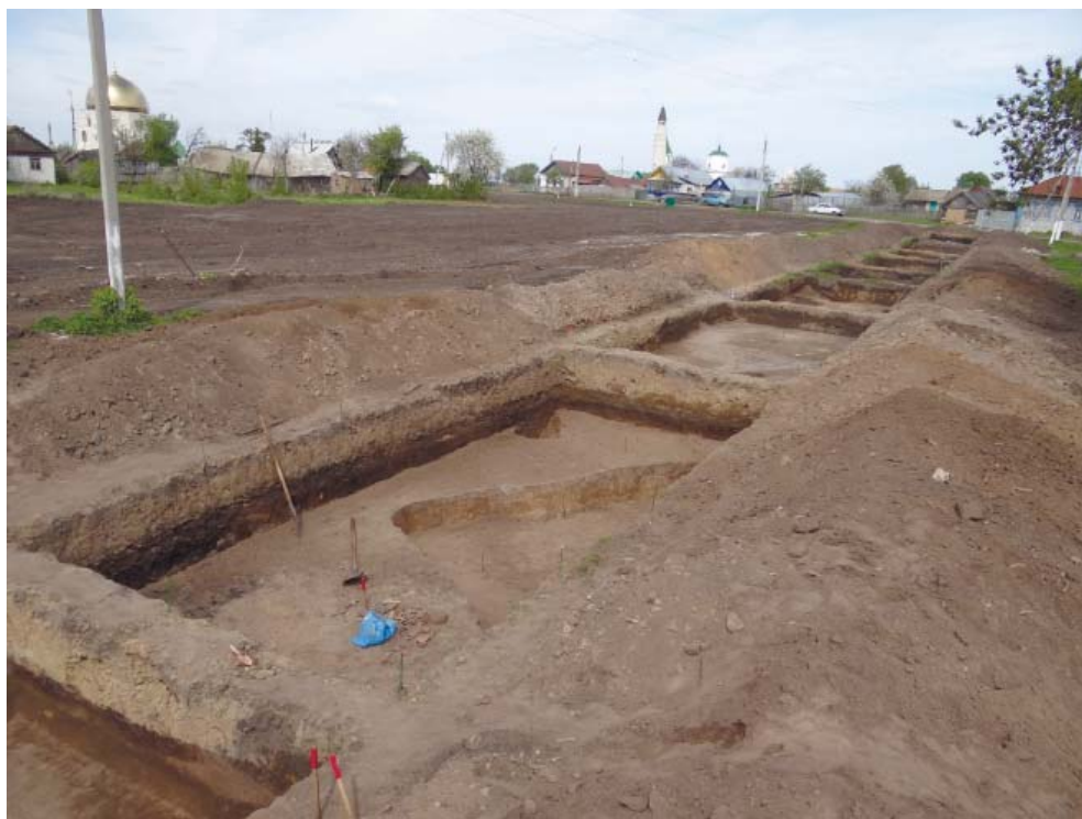
Рис. 3. Раскоп CLXVIII в процессе работ