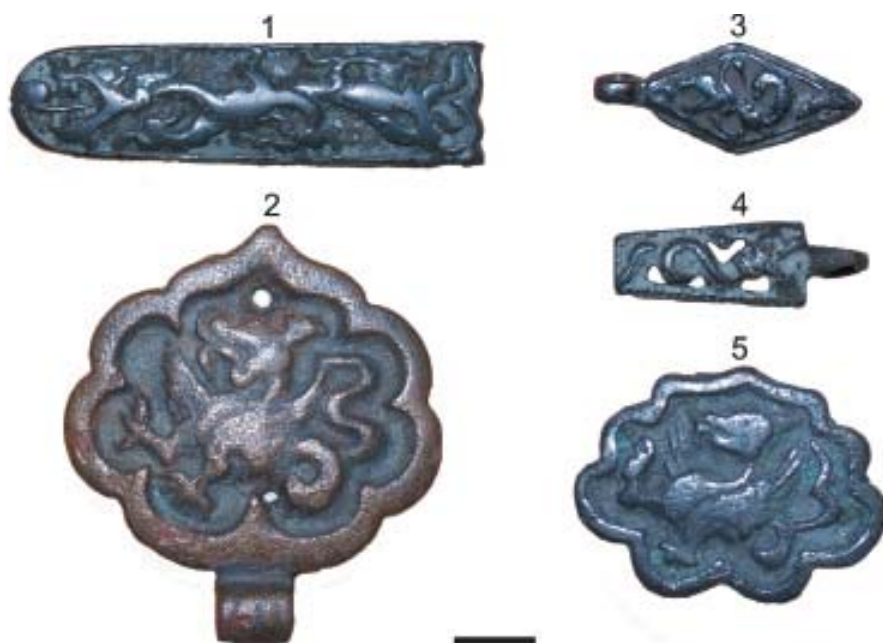
Рис. 2. Бронзовые поясные гарнитуры с изображением безногого, двух-, трех- и четырехпалых драконов, происходящие из Поволжья, кон. XIII – нач. XIV вв. (период правления ханов Токты и Узбека). 1, 3–5 – Саратовская область, 2 – Волгоградская область. Коллекция Естественноисторического музея Саратовского государственного технического университета, экспозиция «Археология и этнография». Масштаб – 1 см