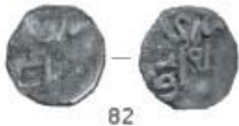
Монеты Лаишевского музея