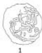
Прорисовка л.с. медной монеты № 1