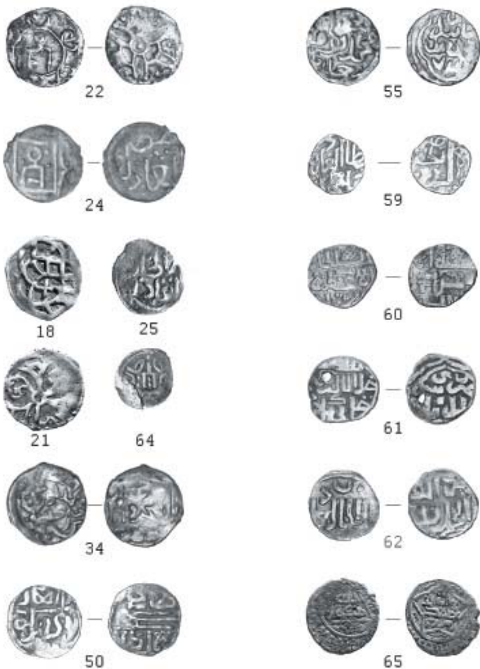
Фототаблица 2. Серебряные монеты с селища Чакма