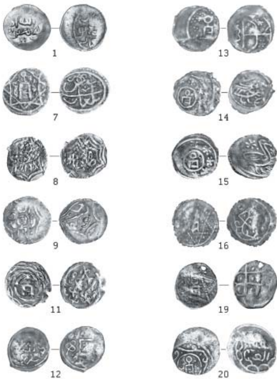
Фототаблица 1. Серебряные монеты с селища Чакма