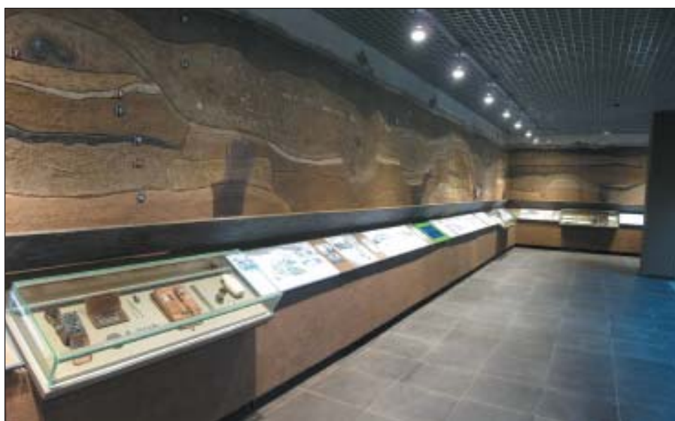
Рис. 8. Экспозиция Музея болгарской цивилизации «Открытие древнего Болгара»