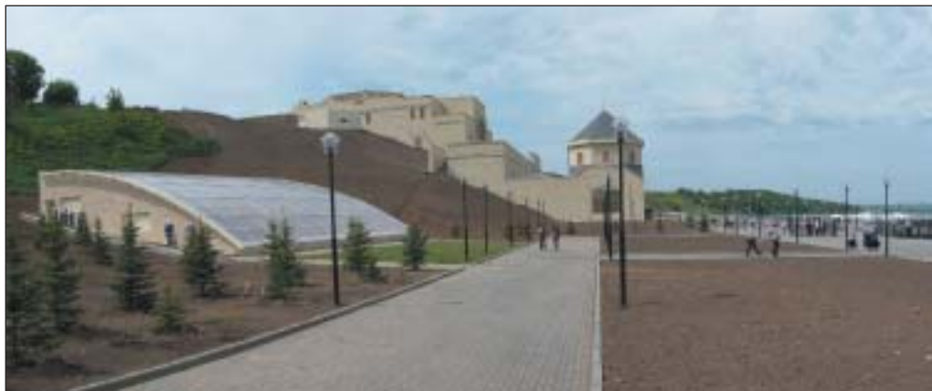
Рис. 1. Здание Музея болгарской цивилизации. Вид с набережной