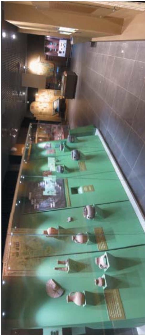
Рис. 5 Экспозиция Музея болгар- ской цивилиза- ции «История болгарской цивилизации»