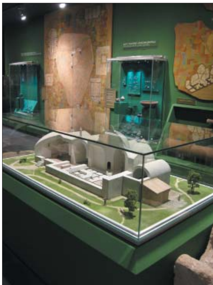
Рис. 7. Экспозиция Музея болгарской цивилизации «Древний Болгар: жизнь города»