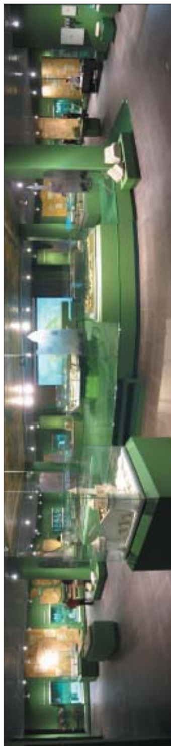
Рис. 6. Экспо- зиция Музея болгарской цивилизации «Древний Болгар: жизнь города»