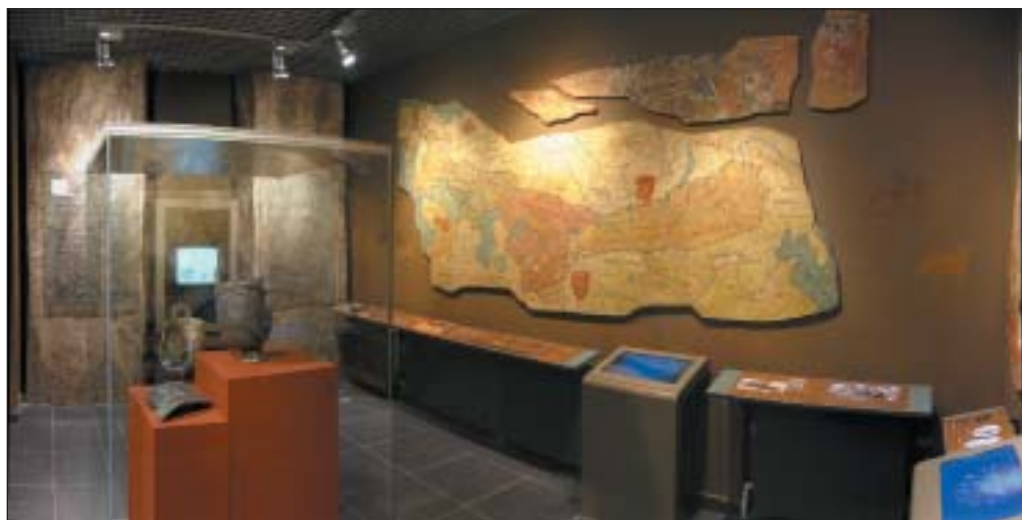
Рис. 2. Экспозиция Музея болгарской цивилизации. Раздел «Истоки тюркской цивилизации»

эпоху, как на Западе, так и на Востоке, поэтому раздел состоит из двух частей: «Держава хунну» и «Великое переселение народов». В рамках темы «Великое переселение народов» акцент сделан на вопросах истории гуннов на Западе, что обусловлено целым рядом причин. Во-первых, приход гуннов открыл длинную череду вторжений восточных, главным образом тюркоязычных народов в степную и лесостепную полосу Восточной и Центральной Европы. Во-вторых, в числе племен, участвовавших в гуннском движении и после распада