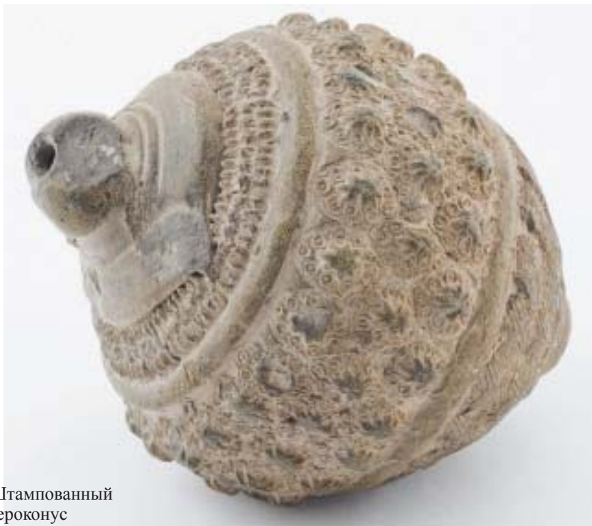
Рис. 8. Штампованный сфероко́нус

сосудов (НВСП 29924; НВСП 31984; НВСП 43523). По белой глине заметны трещины перпендикулярно движению ножа. В раскопах 2010–2012 гг. подобные фрагменты датируются XIII в. В частности, в закрытых комплексах, датируемых пожаром 1290-х годов (Кубанкин, 2012а, с. 182, рис. 9), и в слоях, сформировавшихся до 1280-х годов. Место производства пока не установлено, возможно, это Средняя Азия или Иран.