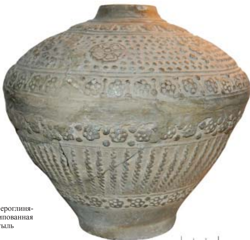
Рис. 6. Сероглиняная штампованная бутыл