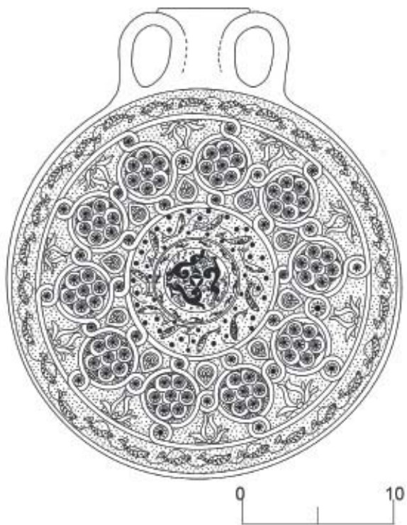
Рис. 2. Хорезмийская сероглиняная штампованная фляга. Рисунок С.А. Бузланова