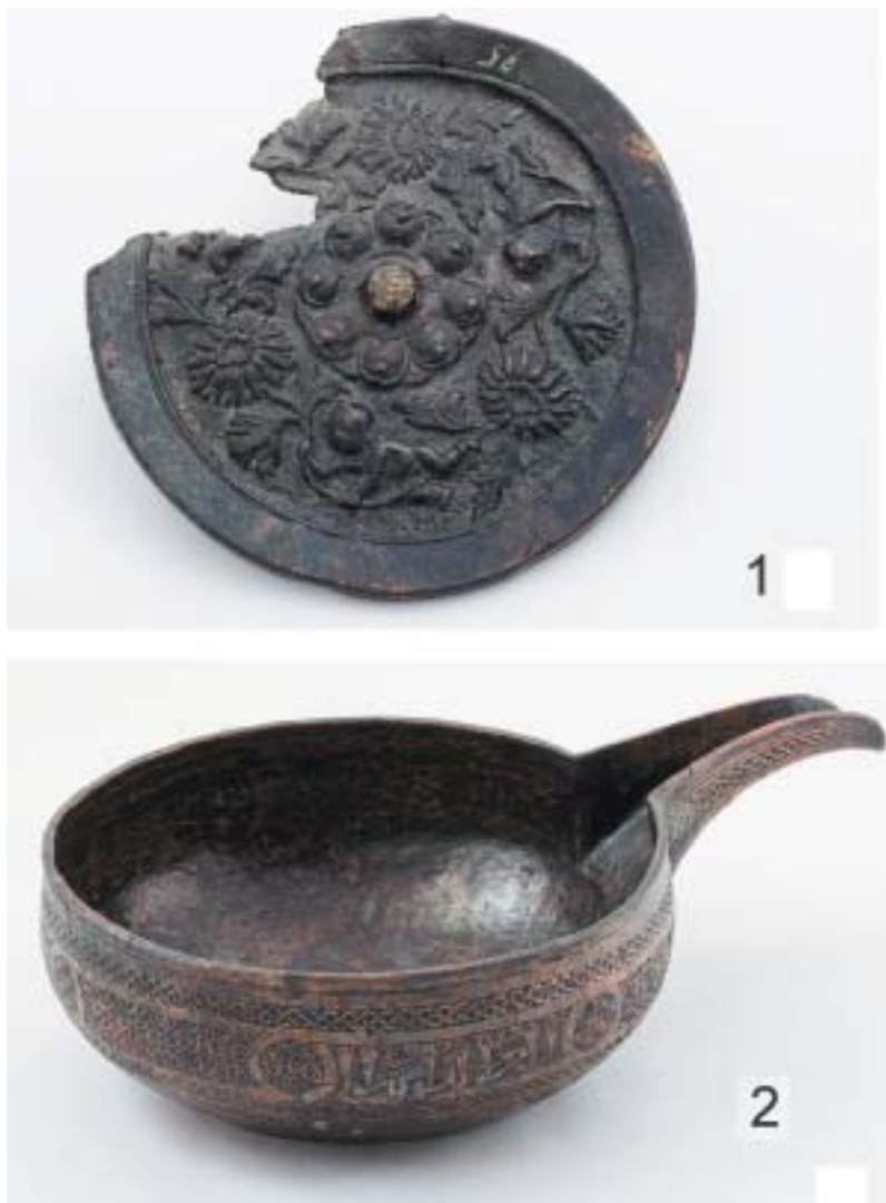
Рис. 1. Металлический импорт: 1 – китайское зеркало с изображением Сяней; 2 – иранский ковш для пира

ным орнаментом (СМК 57812; Недашковский, 2000, с. 55, 57, рис. 10: 8). Полусферическая петля является центром рельефной восьмилепестковой розетки, вокруг которой парят три антропоморфных существа с хризантемами. Наиболее вероятно, что здесь изображены бессмертные Сяни. В даосской традиции это были существа, обретающие бессмертие и сверхесте-