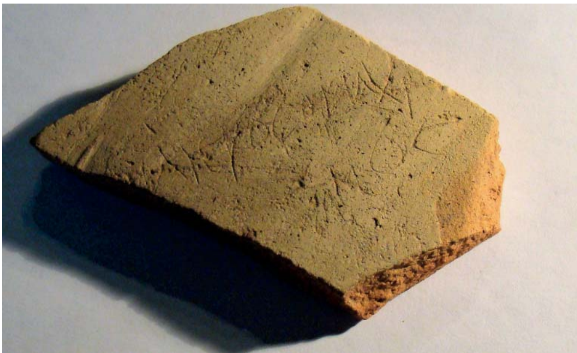
Рис. 1. Остракон, пол. № М.86-156. Фото А.П. Бехтер, 2018 г. Fig. 1. Ostrakon, field № М.86-156. А.Р. Bekhter, 2018.

териалами экспедиции 1982–1997 гг. Объект в настоящее время находится на временном хранении в ИИМК РАН, не числясь на балансе какого-либо музея и соответственно инвентарного номера не имеет, полевой номер М.86-156. Это фрагмент амфорной стенки со светлым покрытием длиной 6,5 см, шириной 9,5 см (рис. 1). Черепок выглядит как практически полностью сохранившийся остракон (сколот только правый нижний угол), однако повреждение первой буквы в стк. 1 показывает, что слева мог быть отбит и довольно значительный фрагмент.