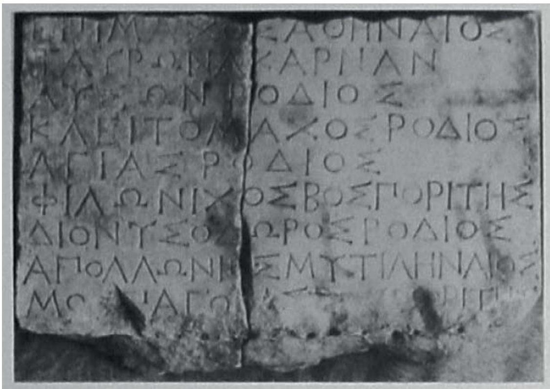
Рис. 2. IFayoum III 193.