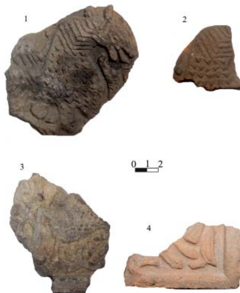
Рис. 2. Изразцы с изображениями животных. 1 – грифон; 2 – шея грифона; 3 – грифон; 4 – передние лапы животного.