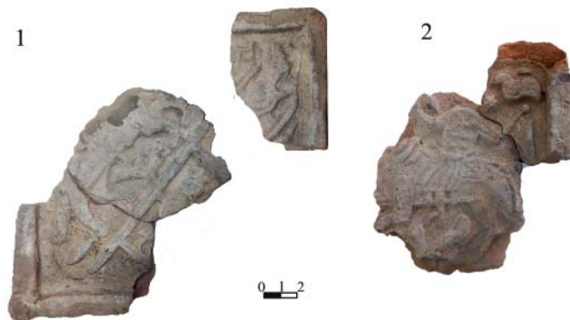
Рис. 3. Изразцы с изображениями людей. 1 – осада; 2 – всадник на лошади.