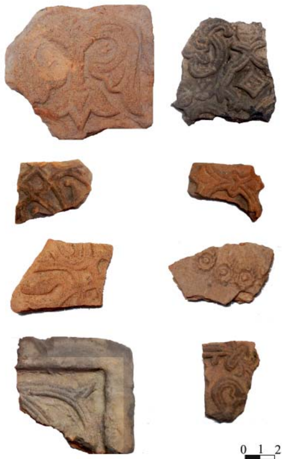
Рис. 4. Изразцы с растительным орнаментом.