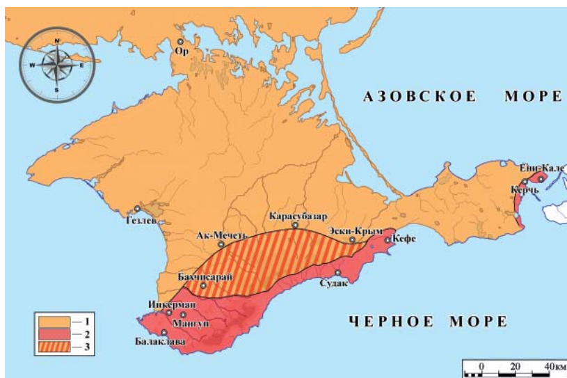
Рис. 1. Политическая карта Крымского полуострова с расположением городов, 1774 г. 1 – Крымское ханство, 2 – Османская империя, 3 – территории Крымского ханства, занятые христианским населением.