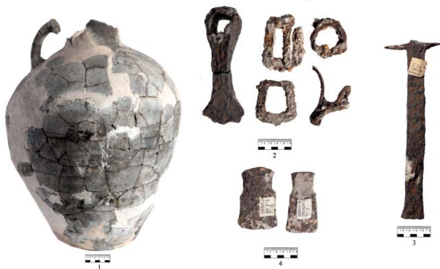
Рис. 2. Вещи из «трупосожжений», раскопанных М.Л. Швецовым, на археологическом комплексе у с. Маяки. 1 – сосуд (трупосожжение 1); 2 – кетмень (трупосожжение 1), пряжки и конские путы (трупосожжение 3); 3 – «клевец» (трупосожжение 3); 4 – тесла-мотыжки (трупосожжение 3).