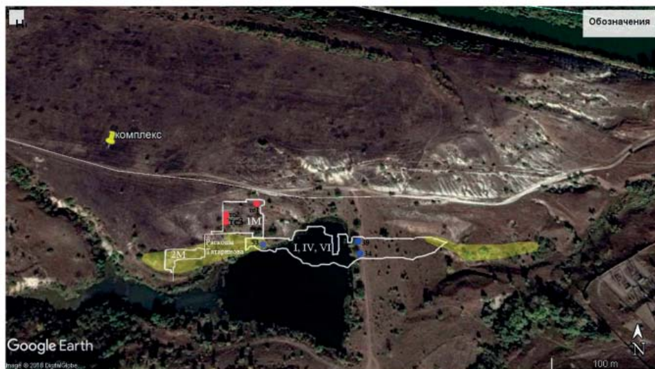
Рис. 5. Археологический комплекс Маяки. Схема расположения раскопов В.К.Михеева (1963–1965, 1968 гг.), С.И.Татарина (1976, 1978 гг.), М.Л. Швецова и Э.Е.Кравченко (1988–1989 гг.) и комплекса, расчищенного в 2012 году. Желтым цветом отмечены предполагаемые границы раскопов хазарского времени, синими кружками – кремации, расчищенные В.К. Михеевым, а красными – «кремации», расчищенные М.Л. Швецовым. За основу взята карта GOOGLE «Планета Земля».

Fig. 5. The archaeological complex Mayaki. The scheme of location of V.K. Mikheev's excavations (1963–1965 and 1968), S.I. Tatarinov (1976, 1978), M.L. Shvetsov and E.E. Kravchenko (1988–1989) and the complex cleared in 2012. The yellow colour indicates the proposed boundaries of Khazar excavations and the blue circles indicate cremations, cleared by V.K. Mikheev, and red circles indicate "cremations" cleared by M.L. Shvetsov. The GOOGLE map "Planet Earth" was taken as the basis.