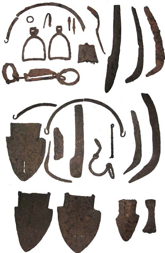
Рис. 7. Фотографии железных предметов, происходящих из опубликованных В.В. Давыденко «комплексов» поселения Государев Яр.

Fig. 7. The photos of iron objects, originating from published by V.V. Davydenko's "complexes" of the Gosudarev Yar settlement.