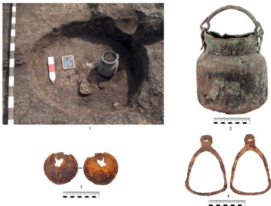
Рис. 3. Археологический комплекс Маяки. Фото и вещи из комплекса, раскопанного в 2012 году. 1 – фото комплекса после расчистки; 2 – медный котел; 3 – железная бляха; 4 – стремена.