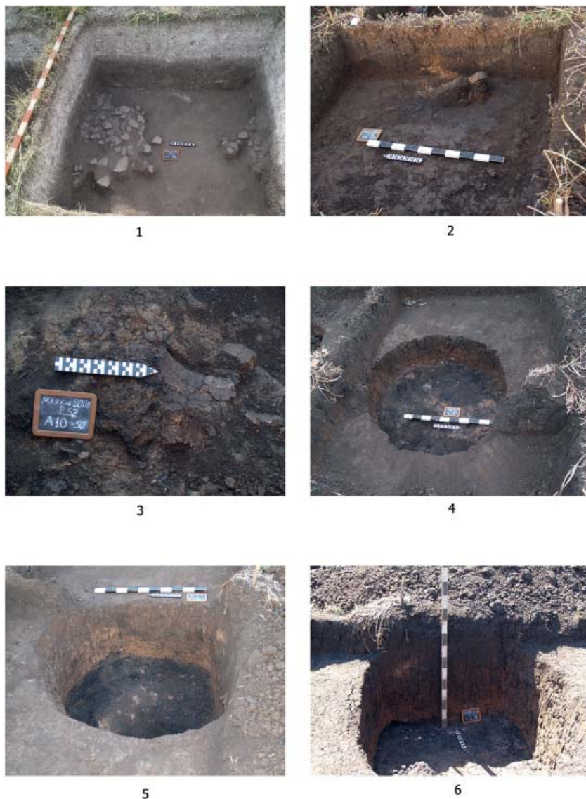
Рис. 6. Археологический комплекс Маяки. Вид скопления керамики (раскоп 31) и хозяйственных ям раскопа 32 (2008 год). 1 – скопление фрагментов керамики в раскопе 31; 2 – горелые пятна в слое раскопа 32 (кв. А-6); 3 – нижняя часть горелого заполнения котлована постройки в раскопе 32; 4 – хозяйственная яма 1 раскопа 32; 5–6 – хозяйственная яма 3 раскопа 32

Fig. 6. The archaeological complex Mayaki. The view of the pottery assemblage (excavation 31) and utility pits of excavation 32 (2008). 1 – the cluster of ceramic fragments in excavation 31; 2 – the burnt stains in the layer of excavation 32 (QA-6); 3 – the lower part of burnt filling of the excavation of a structure in excavation 32; 4 – the utility pit 1 of excavation 32; 5–6 – the utility pit 3 of excavation 32.