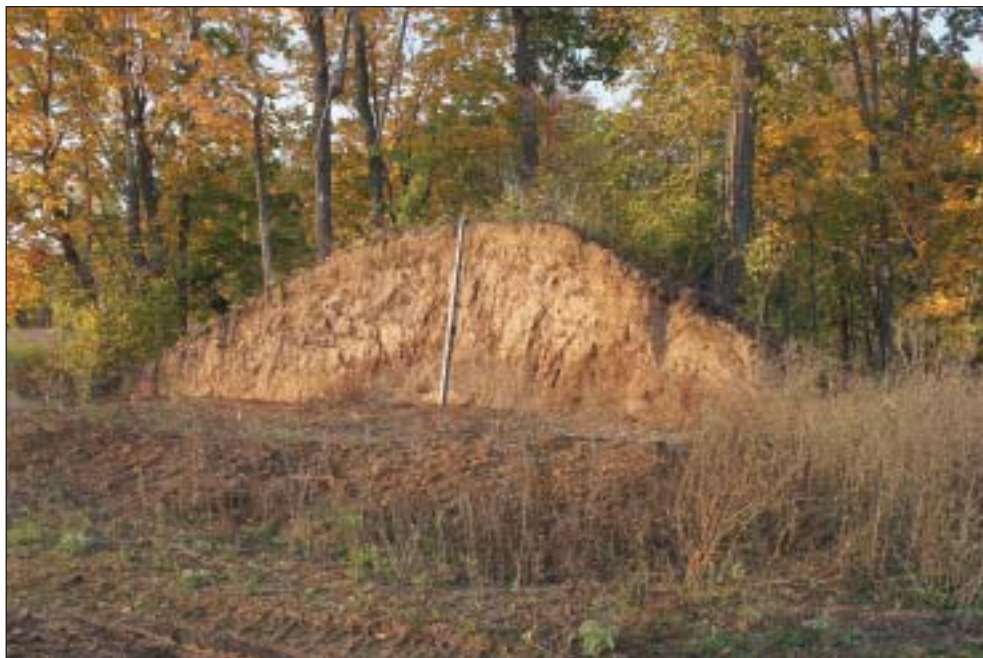
Рис. 3. Фото общего вида раскопа I перед началом работ.