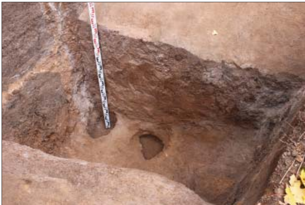
Рис. 6. Фото сооружения 1а. Вид с юго-запада.

несколько раз была разрезана строительной техникой при прокладке нефтепродуктопроводов и газопроводов.