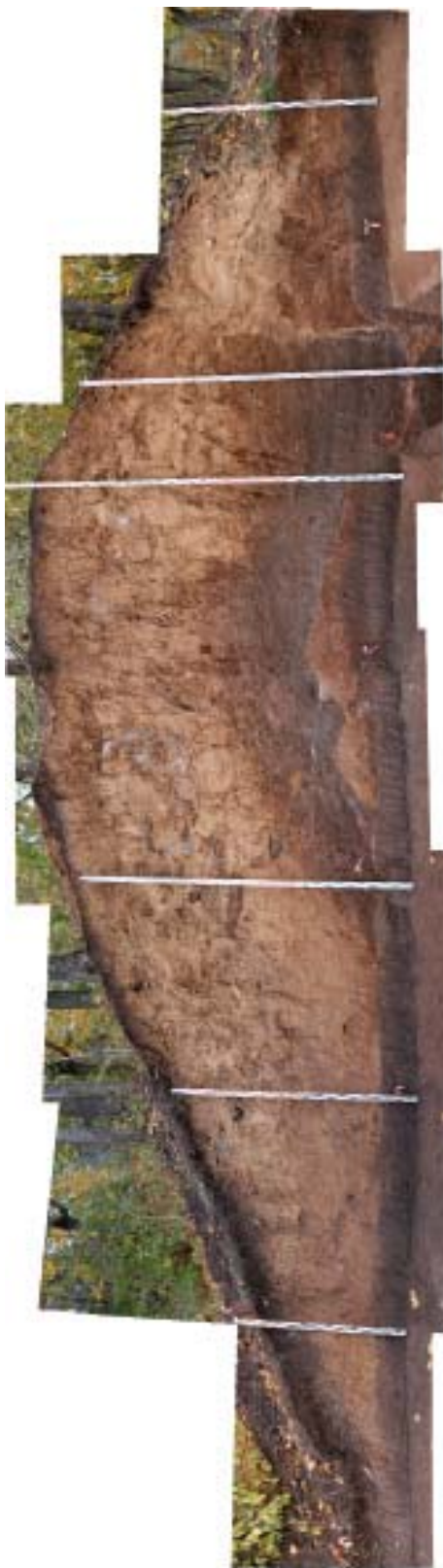
Рис. 5. Фото сечения вала городища Кашан I.