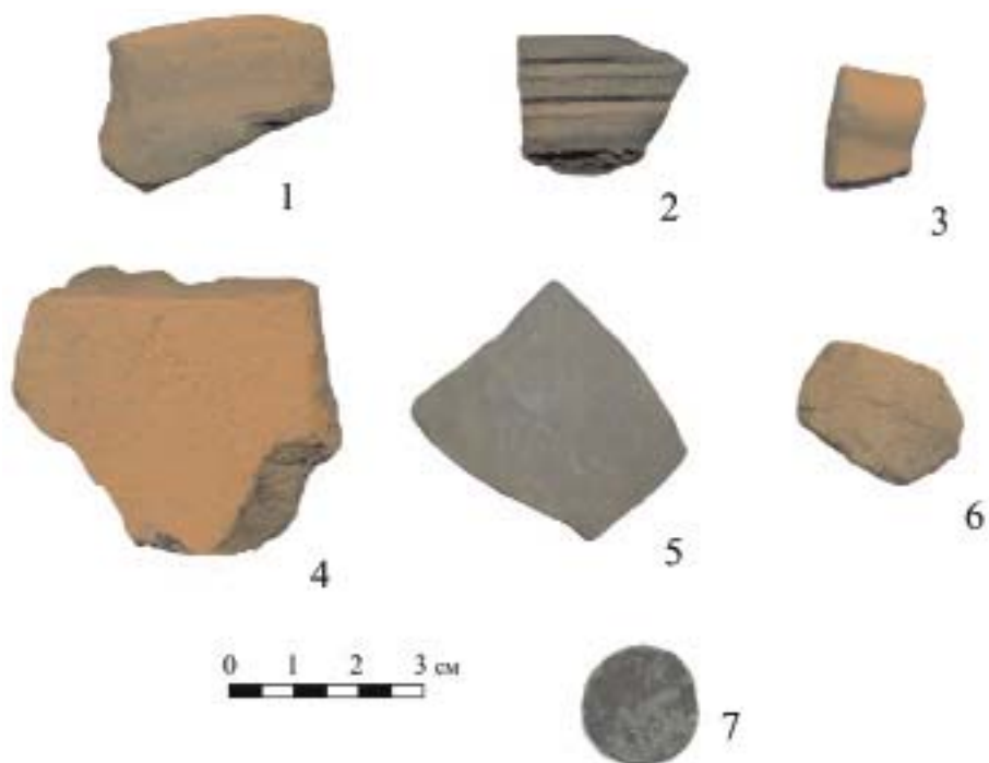
Рис. 2. Подъемный материал с городища. 1–6 – фрагменты керамической посуды общеполгарского типа, 7 – медная золотоордынская монета.