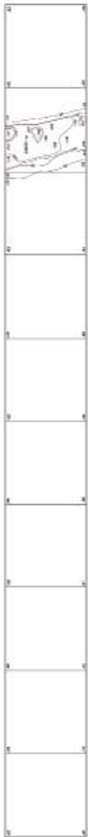
Рис. 4. План раскопа I на уровне материка.