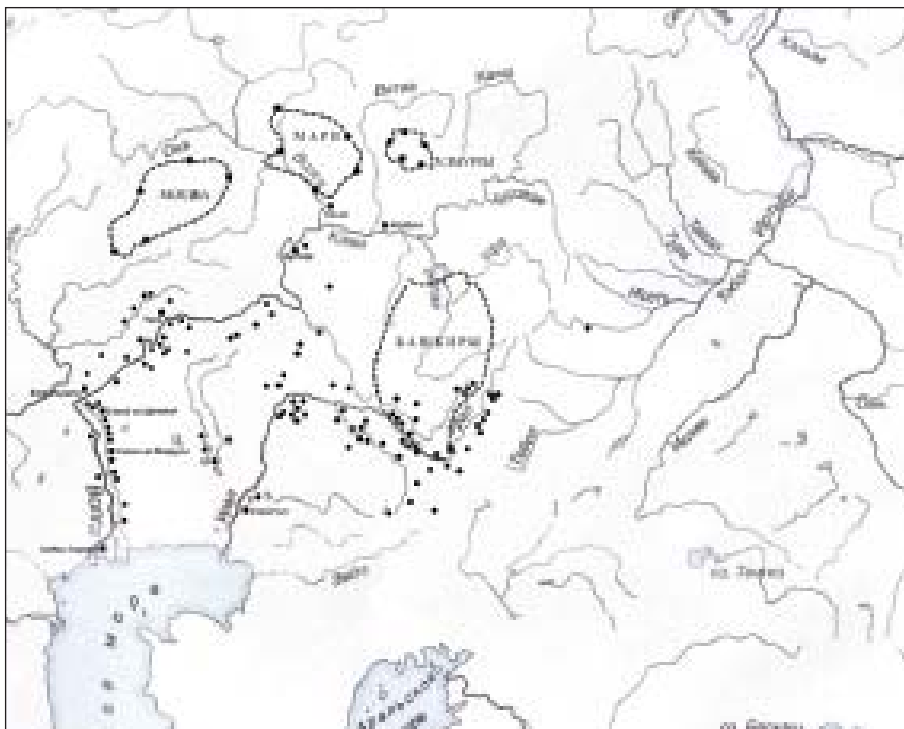
Рис. 2. Этнополитическая карта Урало-Поволжья в XIII–XIV вв. (черные кружки – курганы кочевников; кружки в пунктире – пограничные памятники на этнических территориях).