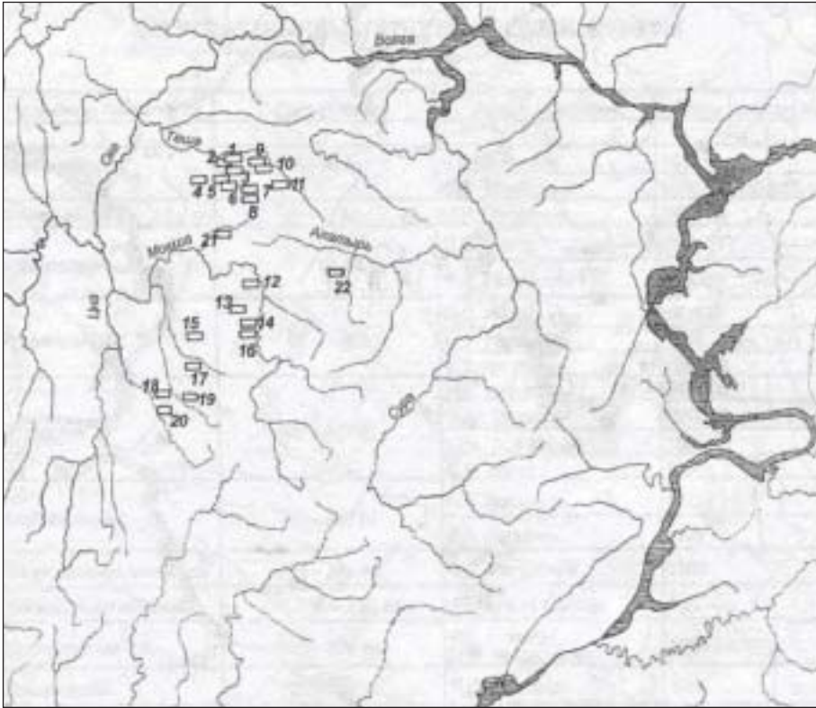
Рис. 3. Погребальные памятники мордвы в XI–XIII вв. (по В.Н. Шитову).