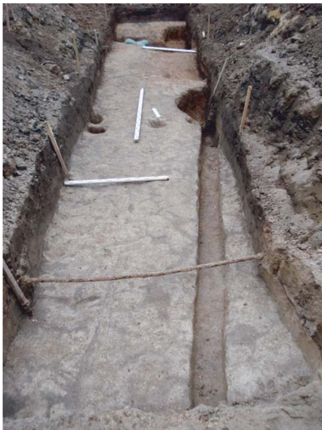
Рис. 4. Раскоп на уровне материка с частокольными канавками (Рождественская слобода).

Fig. 4. Excavation at the level of the mainland with palisade grooves (Rozhdestvenskaya Sloboda).