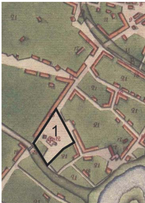
Рис. 1. Карта Царевококшайска 1795 г. (фрагмент).

1 – территория, прилегающая к Входуиерусалимской церкви.