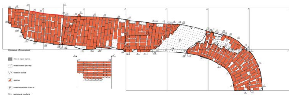
Рис. 3. Фундамент Входаиерусалимской церкви (1759 г.). Чертеж (выполнен М.А.Капитоновой).