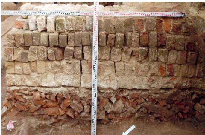
Рис. 5. Фундамент привратной постройки Богородице-Сергиевского монастыря.

Fig. 5. The foundation of the gatehouse of the Bogoroditse-Sergievsky Monastery.