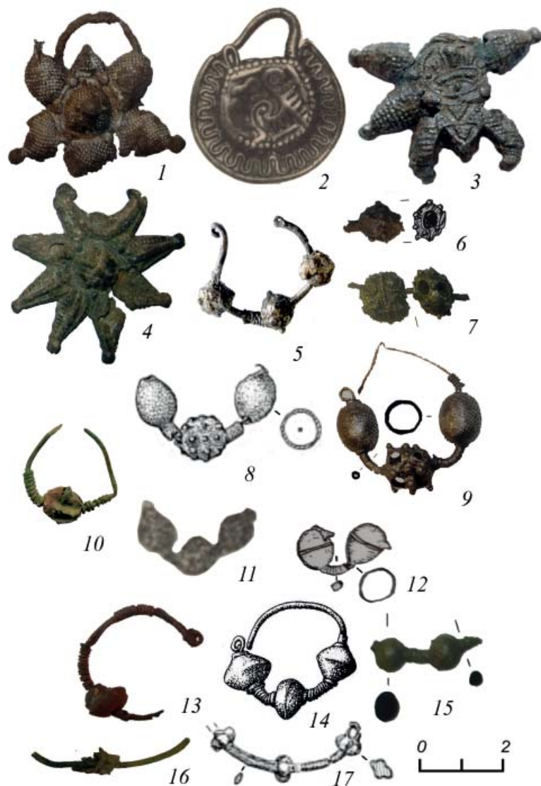
Рис. 2. Колты, рясна и бусинные височные кольца из памятников Верхневолжья второй половины XII–XIII вв. 1–4 – колты; 5–9, 10–17 – височные кольца. 1, 6–10, 12, 15, 17 – Тверь, кремль; 2, 11 – кург. гр. Микулино Городище; 3, 5 – Усть-Шексна; 4 – Дубна; 14 – кург. гр. Кидомля; 13 – Тверь, некрополь в кремле; 16 – Тверь, Затмацкий посад. 1, 6, 7, 9, 12, 15 – по А.Н. Хохлову, А.Б. Ивановой, 2016; 2 – по А.А. Спицыну, 2011; 3 – РМ, № РБМ-37375/95; 4 – по Ф.Н. Петрову, Л.В. Пантелеевой, И.Б. Даченкову, 2012; 5 – РМ, № РБМ-37375/71; 8, 17 – по В.А. Лапшину, 2009; 10 – РМ, № РБМ-18289; 13 – по Л.А. Беляеву, И.А. Сафаровой, А.Н. Хохлову, 2017; 15 – по Е.Н. Жуковой, Ю.В. Степановой, 2010.

Fig. 2. Kolts, ryanas and bead temple rings from the Upper Volga sites of the second half of the 12 th – 13 th centuries. 1–4 – kolts; 5–9, 10–17 – temple rings. 1, 6–10, 12, 15, 17 – Tver, the Kremlin; 2, 11 – barrow burial mound, Mikulino Gorodishche; 3, 5 – Ust-Sheksna; 4 – Dubna; 14 – barrow burial mound Kidomlya; 13 – Tver, necropolis in the Kremlin; 16 – Tver, Zatmatsky posad. 1, 6, 7, 9, 12, 15 – after A. N. Khokhlov, A. B. Ivanova, 2016; 2 – after A. A. Spitsyn, 2011; 3 – RM, no. RBM-37375/95; 4 – after F. N. Petrov, L. V. Panteleeva, I. B. Dachenkov, 2012; 5 – RM, No. RBM-37375/71; 8, 17 – after V. A. Lapshin, 2009; 10 – RM, No. RBM-18289; 13 – after L. A. Belyaev, I. A. Safarova, A. N. Khokhlov, 2017; 15 – after E. N. Zhukova, Yu. V. Stepanova, 2010.