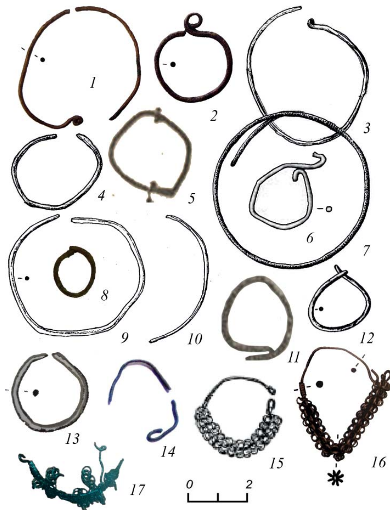
Рис. 3. Проволочные височные кольца из памятников Верхневолжья рубежа XII–XIII – XIV вв. 1–3, 6, 14 – загнутоконечные; 4, 5, 7–13 – с заходящими и с несомкнутыми концами; 15–17 – со спиральным декором. 1, 2 – Тверь, некрополь в кремле; 3, 4 – Высокино; 5 – Микулино Городище; 6 – Тверь, кремль; 7 – Кидомля, 8, 9 – Избрижье; 10 – Тверь, Затьмацкий посад; 11 – Микулино Городище; 12 – Беседы-2, курган 5; 13 – Митрошино-2; 14 – Дубна; 15, 16 – Тверь, кремль; 17 – Тверь, Затьмацкий посад. 1, 2 – по Л.А. Беляеву, И.А. Сафаровой, А.Н. Хохлову, 2017; 3, 4, 7–9 – по Е.Н. Жуковой, Ю.В. Степановой, 2010; 5, 11 – по А.Н. Вершинскому; 6, 15 – по В.А. Лапшину; 8 – по А.В. Лагуткину, находка 2020 г.; 14 – МД, № ДМАК КП 62; 16 – по А.Н. Хохлову, А.Б. Ивановой; 17 – МОК ТвГУ, № КВФ/92-1997.

Fig. 3. Wire temple rings from the monuments of the Upper Volga region at the turn of the 13 th – 14 th centuries. 1–3, 6, 14 – with bent ends; 4, 5, 7–13 – with overlapping and open ends; 15–17 – with spiral decoration. 1, 2 – Tver, necropolis in the Kremlin; 3, 4 – Vysokino; 5 – Mikulino Gorodishche; 6 – Tver, the Kremlin; 7 – Kidomlya, 8, 9 – Izbryzhie; 10 – Tver, Zatmatsky posad; 11 – Mikulino Gorodishche; 12 – Besedy-2, barrow 5; 13 – Mitroshino-2; 14 – Dubna; 15, 16 – Tver, the Kremlin; 17 – Tver, Zatmatsky posad. 1, 2 – after L. A. Belyaev, I. A. Safarova, A. N. Khokhlov, 2017; 3, 4, 7–9 – after E. N. Zhukova, Yu. V. Stepanova, 2010; 5, 11 – after A. N. Vershinsky; 6, 15 – after V. A. Lapshin; 8 – after A. V. Lagutkin, find of 2020; 14 – MD, No. DMAK KP 62; 16 – after A. N. Khokhlov, A. B. Ivanova; 17 – Museum Educational Complex of Tver State University, No. KVF/92-1997.