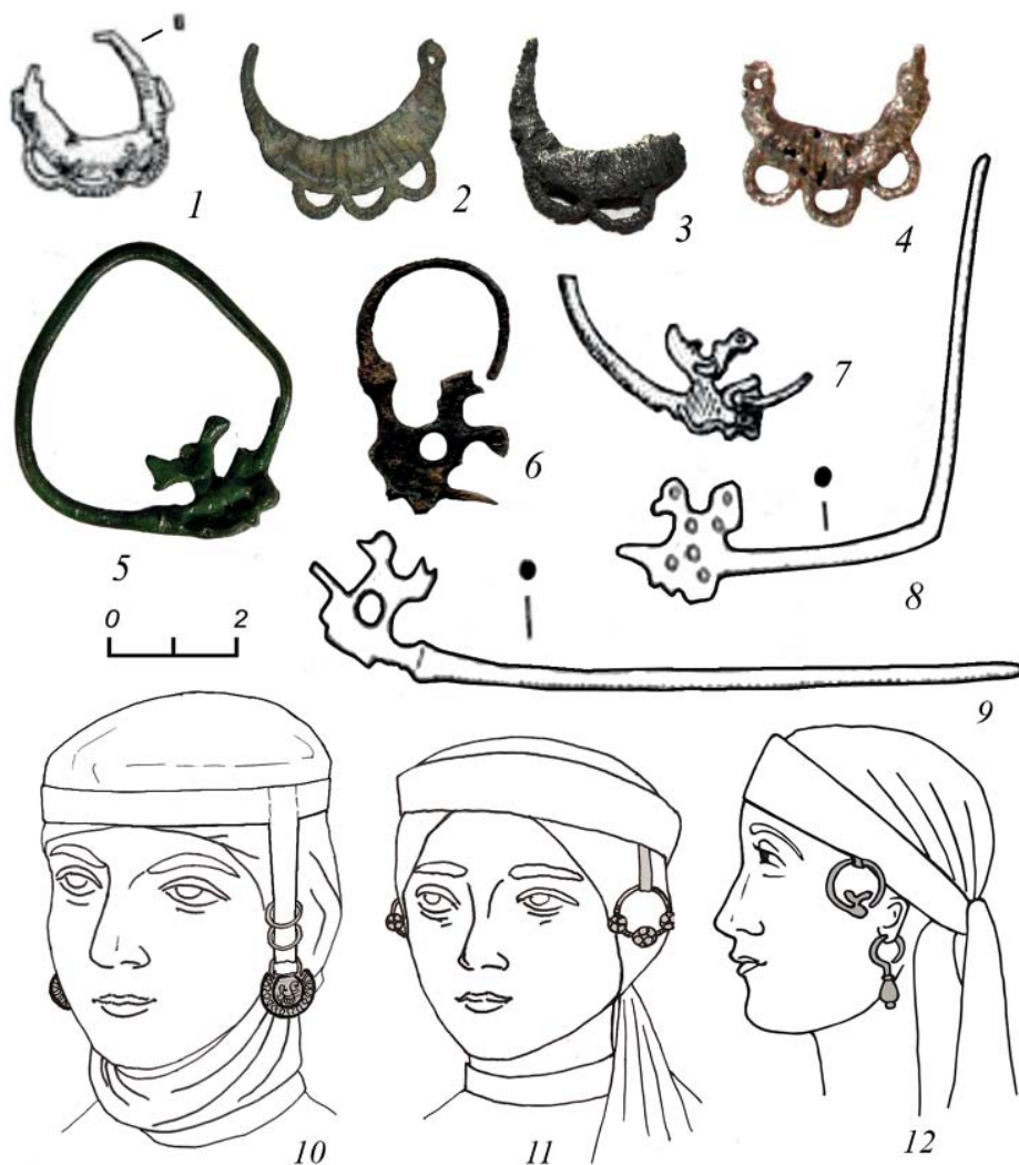
Рис. 4. Литые лунничные височные кольца, височные кольца и булавки с фигурной лопастью из памятников Верхневолжья XIII–XV вв. и реконструкции головного убора с украшениями. 1–4 – лунничные височные кольца; 5–7 – височные кольца с птичкой; 8, 9 – булавки с зооморфным навершием; 10 – убор колтами XIII в.; 11 – убор с бусинными височными кольцами XIII–XIV вв.; 12 – убор с височными кольцами с фигурной лопастью и серьгами XIV–XV вв. 1 – Тверь, кремль; 2, 7 – Дубна; 3–6 – Усть-Шексна; 8, 9 – Тверь, Затматский посад. 1 – по В.А. Лапшину, 2009; 2, 7 – по Ф.Н. Петрову, Л.В. Пантелеевой, И.Б. Даченкову, 2012; 3 – РМ, № НВФ-10113; 4 – РМ, № РБМ-33517/74; 5 – РМ, № РБМ-34353/27; 6 – РМ, № РБМ-28550/28; 8, 9 – по В.В. Солдатенковой, 2008; 10–12 – рисунки автора.

Fig. 4. Cast lunular temple rings, temple rings and pins with a figured blade from the monuments of the Upper Volga region of the 13 th –15 th centuries and reconstruction of a headdress with adornments. 1–4 – lunular temple rings; 5–7 – temple rings with a bird; 8, 9 – pins with a zoomorphic top; 10 – dress with kolts of the 13 th century; 11 – dress with beaded temple rings of the 13 th –14 th centuries; 12 – dress with temple rings with a figured blade and earrings of the 14 th –15 th centuries. 1 – Tver, the Kremlin; 2, 7 – Dubna; 3–6 – Ust-Sheksna; 8, 9 – Tver, Zatmatsky posad. 1 – after V. A. Lapshin, 2009; 2, 7 – after F. N. Petrov, L. V. Panteleeva, I. B. Dachenkov, 2012; 3 – RM, No. NVF-10113; 4 – RM, No. RBM-33517/74; 5 – RM, No. RBM-34353/27; 6 – RM, No. RBM-28550/28; 8, 9 – after V. V. Soldatenkova, 2008; 10–12 – drawings by the author.