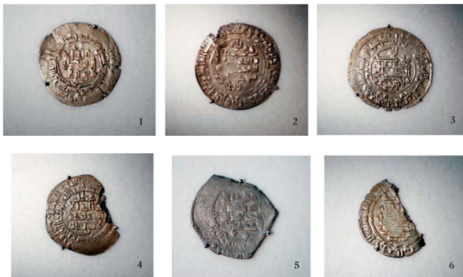
Рис. 3. Монеты X – первая половина XI в. н. э. Fig. 3. Coins of the 10 th – first half of the 11 th centuries AD.

ропы мусульманские куфические дирхемы. Известно сообщение Ибн Русте об их поступлении из мусульманских стран в обмен на товары (Хвольсон, 1870, с. 24–25). Ал-Гардизи, автор середины XI в., сообщает: «Потом они те дирхемы отдают русам и славянам, так как те люди не продают товара иначе, как за чеканенные дирхемы» (Заходер, 1967, с. 34–35). В IX–XI вв. поток дирхемов с Востока шел несколькими путями. Главные пути проходили по Дону (и Северному Донцу) и Волге. Основными центрами на Волжском пути были Хазарский каганат и в дальнейшем Волжская Булгария. Монеты со Среднего Поволжья расходились по Оке и вятическим землям и далее в Киев или по верхней Волге в северорусские земли и далее в Скандинавию (Полубояринова, 1993, с. 114). В.Л. Янин отмечал, что через Волжскую Булгарию дирхемы поступали на Русь на первом этапе (конец VIII – 1 треть IX вв.), а уже на втором этапе (830–900 гг.) Волжский путь преобладал над Днепро-Донским. На третьем и четвертом этапах усиливается роль Волжского пути