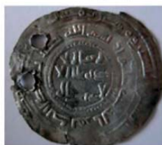
Волжская Болгария. Подражание