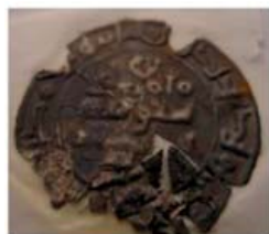
Волжская Болгария. Мумин бин Хасан. Подражание