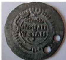
Волжская Болгария. Литая монетовидная подвеска.