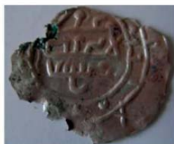
Волжская Болгария. Подражание