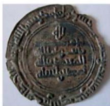
Волжская Болгария. Ал-Муктадир Биллах, Брактеат