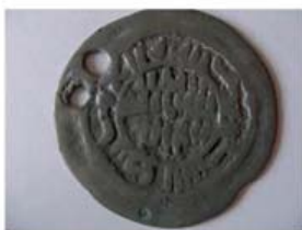
Волжская Болгария. Литая монетовидная подвеска.