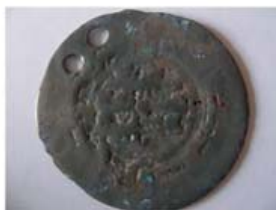
Волжская Болгария. Литая монетовидная подвеска.