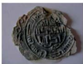
Волжская Болгария. Оттиск изображения на глинe.