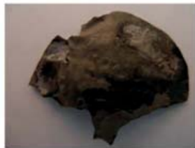
Саманиды. С графитти.