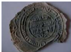
Волжская Болгария. Оттиск изображения на глинe.