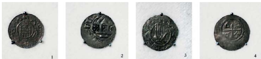
Рис. 8. Монеты XI в. н. э., Западная Европа.