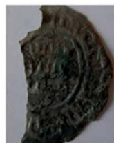
Волжская Болгария. Литое подражание дирхему