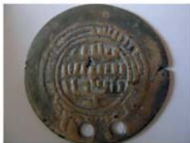
Волжская Болгария. Литая монетовидная подвеска.