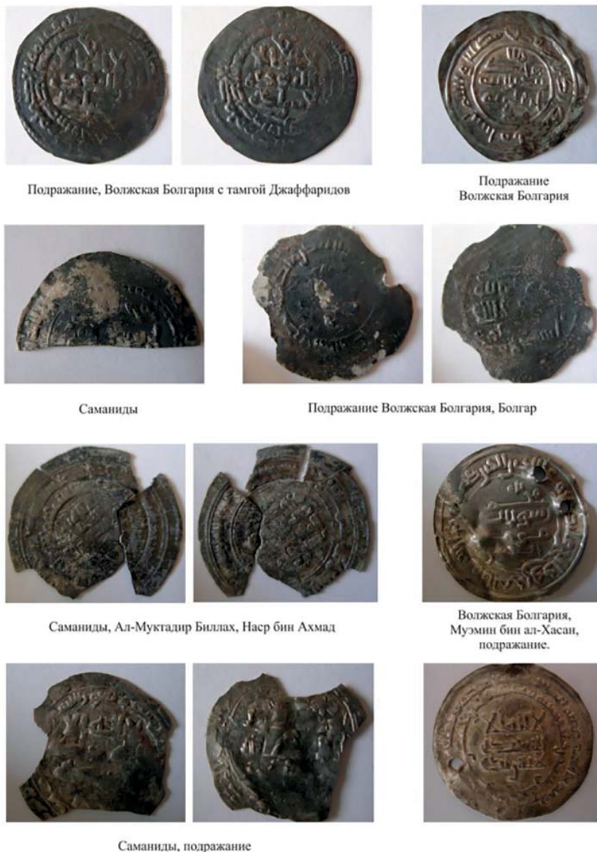
Подражание, Волжская Болгария с тамгой Джафаридовых