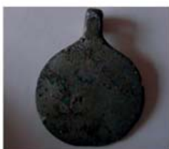
Волжская Болгария. Литая монетовидная подвеска.