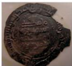
Волжская Болгария. Алмуш хан. (Ал-Амир Бармал)