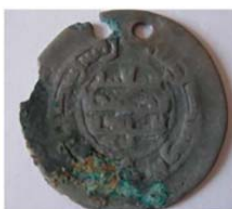
Волжская Болгария. Литая монетовидная подвеска.