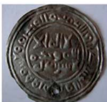
Волжская Болгария. Подражание