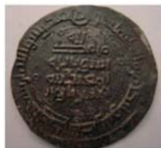
Волжская Болгария. Алмуш хан. (Ал-Амир Бармал)