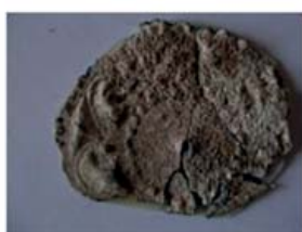
Волжская Болгария. Оттиск изображения на глинe.