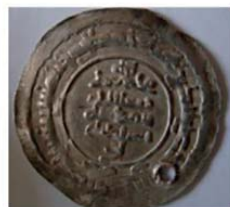
Саманиды, Ал-Мути Биллах, Наср бин Ахмад