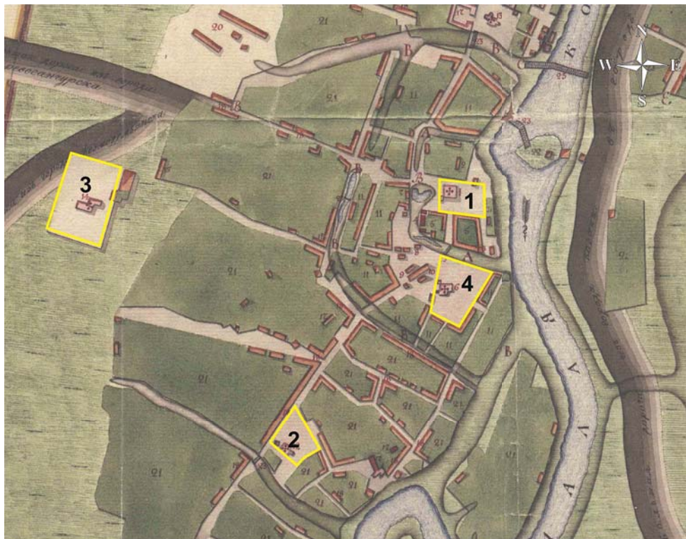
Рис. 1. Местоположение исторических некрополей Царевококшайска на карте города 1795 г. 1 – Воскресенский некрополь; 2 – Входиерусалимский некрополь; 3 – Тихвинский некрополь; 4 – Троицкий некрополь