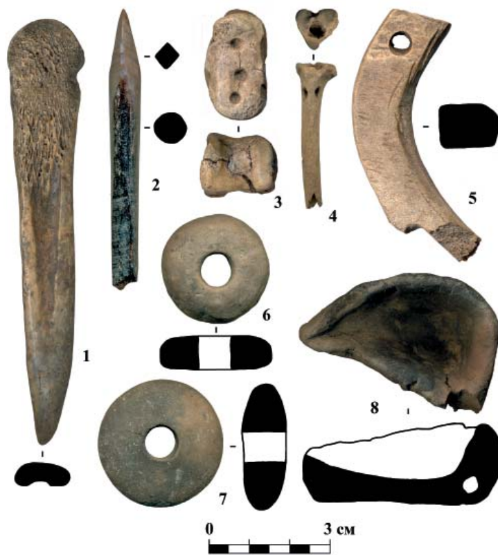
Рис. 2. Предметный комплекс с городища Ярковокое 1. 1 – кочедык, 2 – наконечник стрелы, 3 – астрагал, 4 – игольник, 5 – налобная пластина, 6, 7 – пряслица, 8 – льячка. 1, 2, 4, 5 – кость, 3 – кость, свинец, 6–8 – глина.