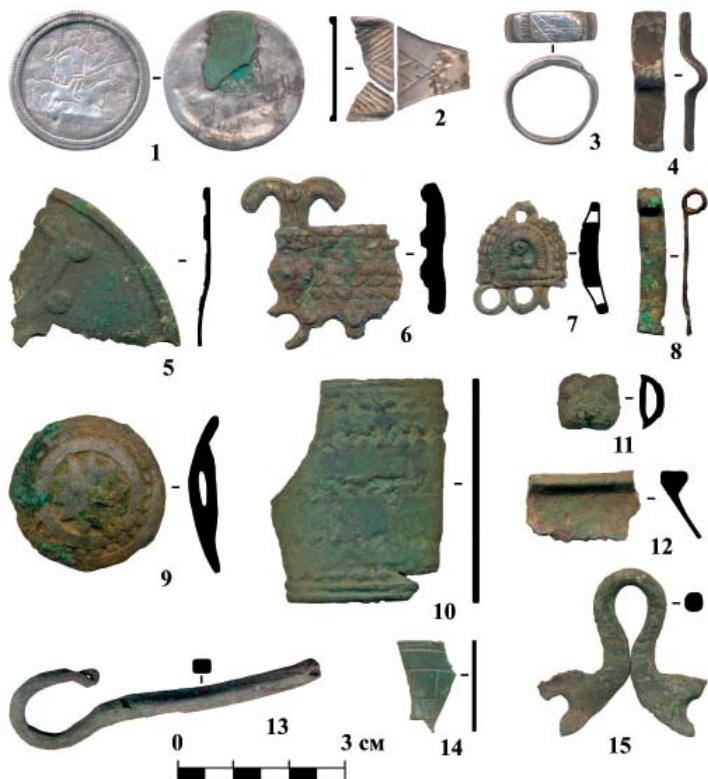
Рис. 1. Предметный комплекс с городища Ярковокое 1. 1, 6, 7 – подвески, 2, 3 – перстни, 4, 8 – детали крепления подвесок, 5 – зеркало, 9 – бляха, 10 – браслет, 11 – накладка, 12, 14 – фрагменты посуды, 13 – дужка, 15 – петля. 1–3 – серебро, 4, 8, 13–15 – медь, 5–7, 9–12 – бронза.