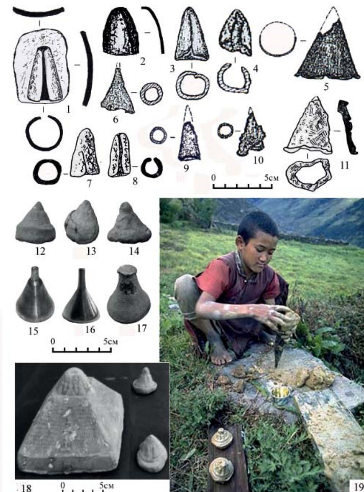
Рис. 4. Конусы (1–11), цаца (12–14), формы для изготовления цаца (15–18) и процесс изготовления цаца (19). 1–10 – конусы из золотоордынских погребений: 1 – на железной пластине (обломке сосуда, ?) из погребения на Вишневой горе (г. Саратов); 2 – Карасуыр, погребение из кургана № 2; 3 – Малияевка, грунтовое погребение 1 (Мыськов, 2015, с. 344, 438, рис. 70, 3); 4 – Веселый V, к. 1, п. 1 (Мыськов, 2015, с. 291, 375, рис. 7, 4); 5 – Нагавский I, к. 2, п. 1 (Мыськов, 2015, с. 371, рис. 3: 7); 6 – Шебалино, курган № 2, погребение 1 (Мыськов, 2015, с. 284, 369, рис. 1: 3); 7, 8 – Новый Кумак II (Иванов, Кригер, 1988, с. 32, рис. 8: 6–7); 9, 10 – Веселый II, к. 2, п. 1 (Мыськов, 2015, с. 290, 374, рис. 6: 12–13). 11 – Маметбай, к. 3 (Иванов, 1988, с. 34, рис. 10: 13); 12–14, 18 – цаца из необоженной глины калмыков конца XIX в. из фондов СОМК; 15–17 – современные бронзовые формы для изготовления цаца из Тибета (Китай); 19 – процесс изготовления цаца в Тибете (Китай) (Хуан Ли, 1995).

Fig. 4. Cones (1–11), tsatsa (12–14), tsatsa (15–18) and the process of making tsatsa (19). 1–10 – cones from the Golden Horde burials: 1 – on an iron plate (on a piece of the vessel?) from the burial on the Vishnevaia mountain (Saratov); 2 – Karasuyr, burial from mound № 2; 3 – Maliaevka, ground burial 1 (Myskov, 2015, p. 344, 438, fig. 70, 3); 4 – Vesiolyi V, mound 1, burial 2 (Myskov, 2015, p. 291, 375, fig. 7, 4); 5 – Nagavsky I, mound 2, burial 1 (Myskov, 2015, p. 371, fig. 3: 7); 6 – Shebalino, mound № 2, burial 1 (Myskov, 2015, p. 284, 369, fig. 1: 3); 7, 8 – Novy Kumak II (Ivanov, 1988, p. 32, fig. 8: 6–7); 9, 10 – Vesiolyi II, mound 2, burial 1 (Myskov, 2015, p. 290, 374, fig. 6: 12–13); 11 – Mametbay, mound 3 (Ivanov, 1988, p. 34, fig. 10: 13); 12–14, 18 – tsatsa from the clay without roasting of the Kalmyks of the late 19th century from the Saratov Regional Museum foundations; 15–17 – modern bronze cones for the manufacture of tsatsa from Tibet (China); 19 – the process of making tsatsa in Tibet (China) (Huang Li, 1995).