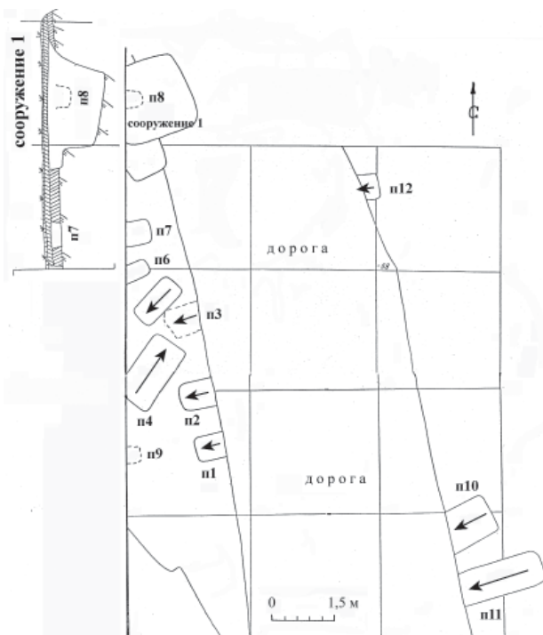
Рис. 2. Общий план раскопа № СХХІV(134).