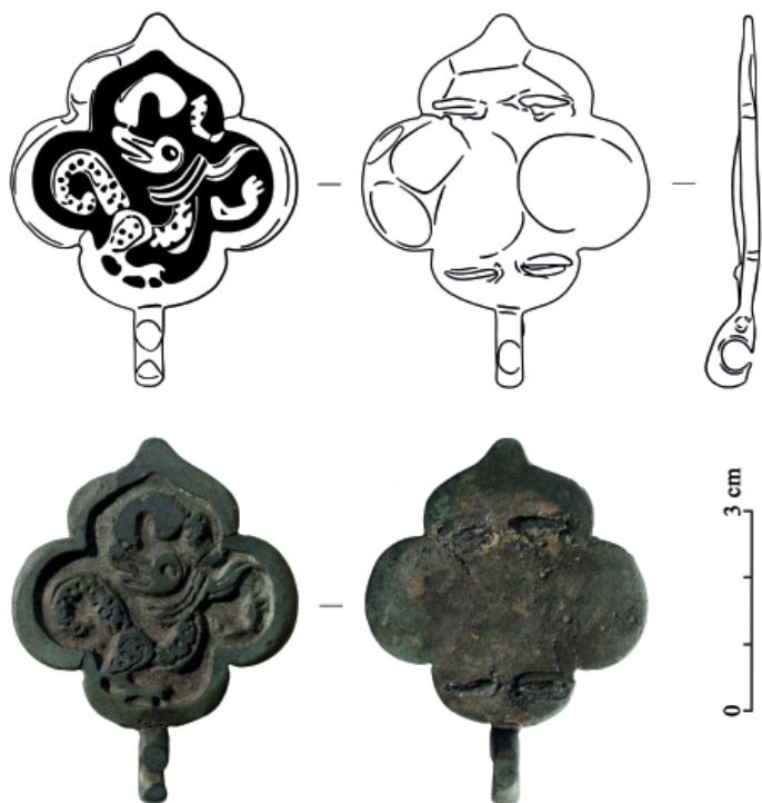
Рис. 2. Бронзовая поясная накладка с полиморфным изображением, найденная у с. Верхоречье (Юго-Западный Крым).