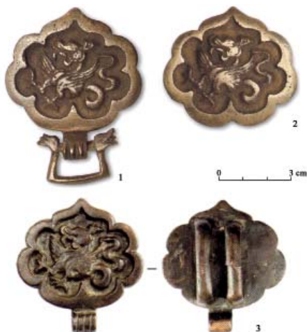
Рис. 3. Бронзовые поясные накладки с изображением дракона: 1, 2 – Астраханская область (по: Золотая Орда..., 2019, с. 238); 3 – Болгар (по: Баранов и др., 2016, с. 52).

Fig. 3. Bronze belt plates with the dragon image: 1, 2 – Astrakhan Region (after: Golden Horde..., 2019, p. 238); 3 – Bolgar (after: Baranov et al., 2016, p. 52).