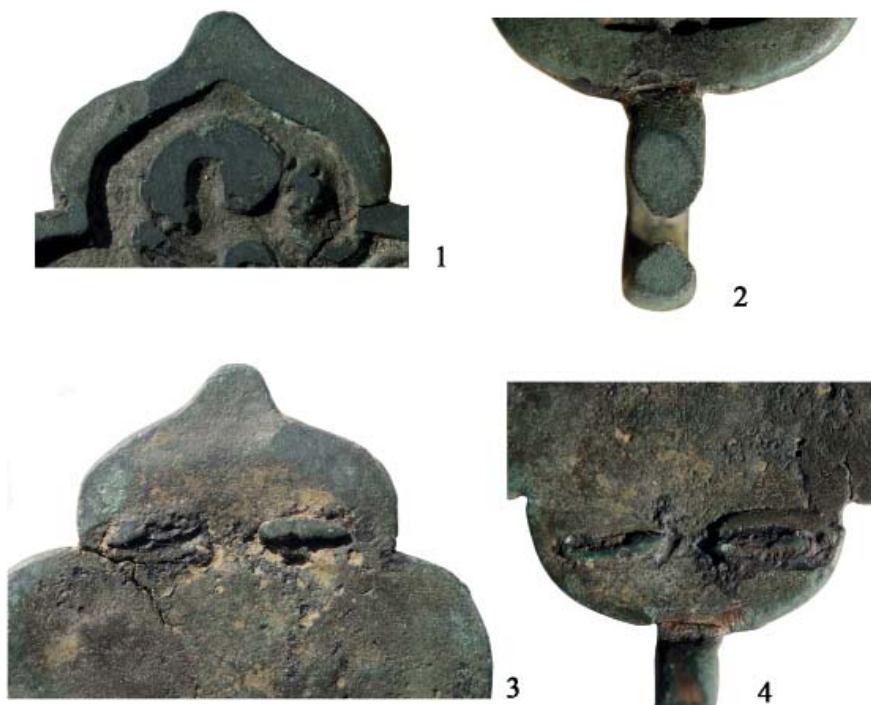
Рис. 6. Следы вторичного использования на поясной накладке из округи с. Верхоречье (без масштаба).