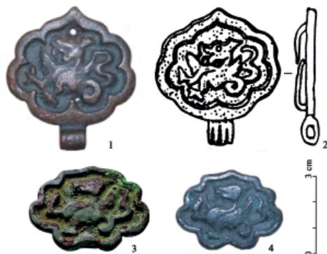
Fig. 4. Bronze belt plates with the dragon image: 1 – Volgograd Region (after: Isakov et al., 2014, Fig. 2, 2); 2 – burial 131 of Kokpomiyag burial ground, the Republic of Komi (after: Savelyeva, Korolev, 2011, Fig. 4, 35); 3 – Bolgar (Rudenko, 2005, coloured illustration 2); 4 – Saratov Region (after: Isakov et al., 2014, Fig. 2, 5).