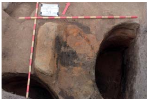
Рис. 3. Сооружение 643. Вид с Ю.

Fig. 2. Kiln pit (structure 476) and kiln (structure 643). View from the north.