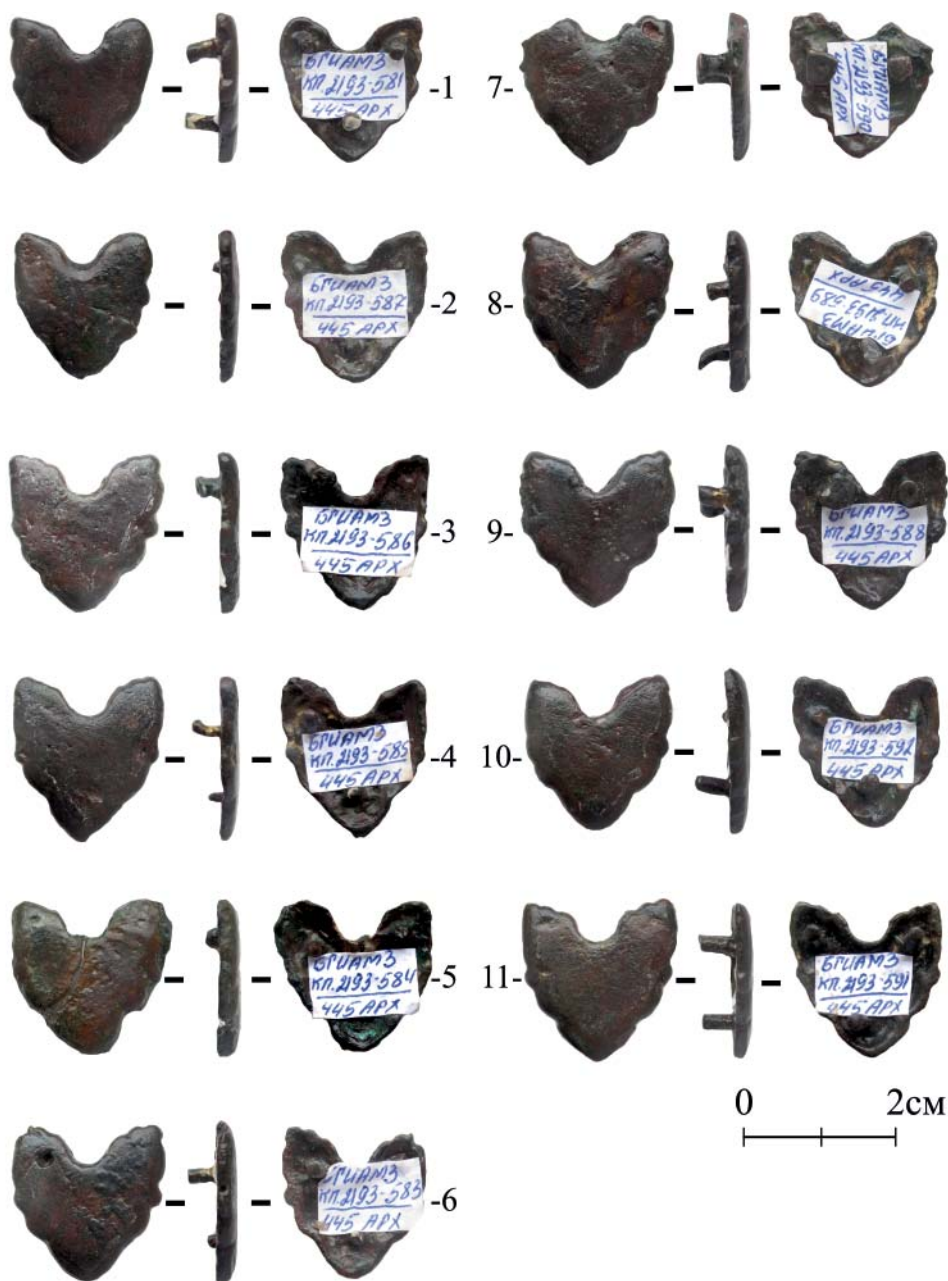
Рис. 5. Накладки подтреугольной формы с фестончатым краем.