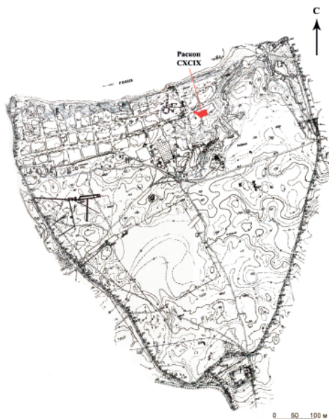
Рис. 1. Топографический план Болгарского городища с местоположением раскопа СХСІХ.

Необходимо отметить, что тема изучения средневековых поясных наборов имеет богатую историографию (Мальм,