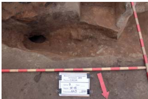
Рис. 2. Предгорновая яма (сооружение 476) и горн (сооружение 643). Вид с С.

Fig. 2. Kiln pit (structure 476) and kiln (structure 643). View from the north.