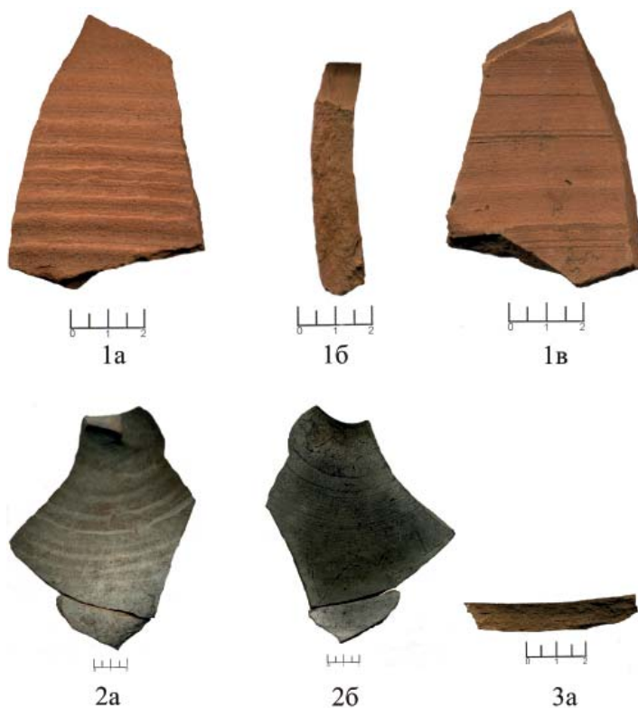
Рис. 3. Фрагменты красноглиняных тарных сосудов – «трапезундских амфор».