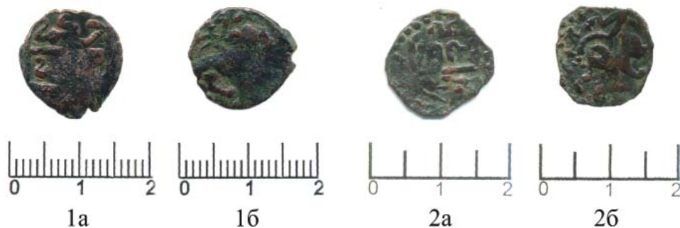
Рис. 1. Монеты медные. Пул анонимный: 1а, 2а – Л.с.В точечный ободок вписан линейный квадрат, разделенный пополам горизонтальной линией, в квадрате надпись «Высочайшее Повеление»; 1б, 2б – О.с. В точечном ободке лев(?) идущий вправо, за спиной льва – солнце. Fig. 1. Copper coins. Anonymous pul: 1a, 2a – Front: A linear square divided in half with a horizontal line is inscribed in a dotted rim; an inscription in the square reads “Highest Commandment”; 1b, 2b – Reverse: A lion (?) walking to the right, and the sun behind the lion’s back are inscribed in a dotted rim.

В геоморфологическом отношении данный земельный участок расположен вблизи бывшей береговой линии Каспийского моря, приурочен к плоской раннехвалынской морской аккумулятивной равнине, очень слабо расчлененной реликтами древних эрозионных ложбин и лиманообразных понижений. Разработкой основных проблем геоморфологии Прикаспия занимались О.К. Леонтьев, Е.Г. Маев, Г.И. Рычагов (Леонтьев, Маев, Рычагов, 1977), М.В. Карандеева (Карандеева, 1959), Ф.Ф. Голынец (Голынец, 1927) и другие.