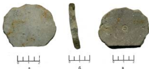
Рис. 4. Предмет, изготовленный из стенки керамического сосуда округло-овальной формы с неровными краями.

мета просматриваются следы лощения, нанесенного при изготовлении сосуда. С внутренней стороны по центру следы сверления циркульным резцом. Обжиг сплошной. На изломе видны зерна песка. Назначение данного предмета можно трактовать по-разному и соответственно строить из этого разные выводы. Если предположить, что данный предмет является заготовкой пряслица, то можно предположить о наличии на поселении ткацкого производства пусть и кустарного. Другой вариант определения данного предмета – как фишка для игр на досках, в том числе нарды и «мельница». В любом случае мы имеем