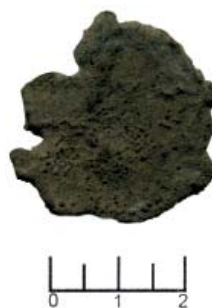
Fig. 7. Copper foundry waste.