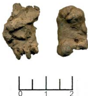
Рис. 7. Отходы меднолитейного производства.