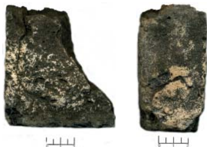
Рис. 5. Фрагмент кирпича по морфологическим признакам соответствующий строительным кирпичам золотоордынского периода.

Fig. 5. Fragment of a brick corresponding to the building bricks of the Golden Horde period in terms of morphological characteristics.