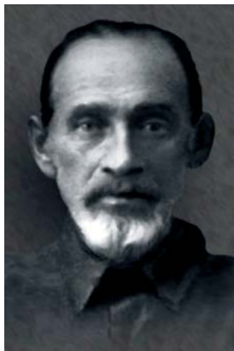
Рис. 1. Александр Августинович Кротков Fig. 1. Alexander Avgustinovich Krotkov.

крыватель и исследователь истории золотоордынского города Мохши.