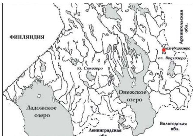
Рис. 1. Карта Карелии. Икшозеро I.