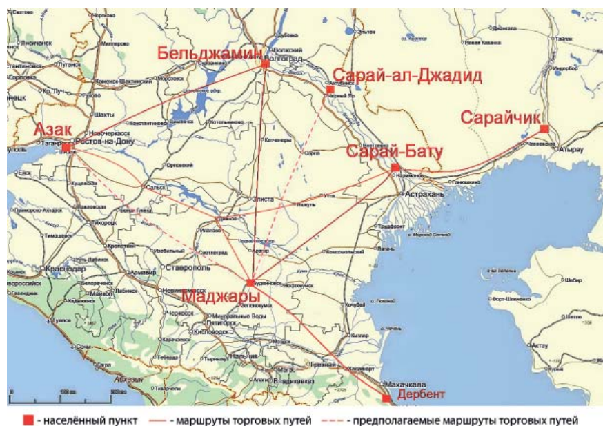
Рис. 1. Реконструкция торговых путей по территории Калмыкии.