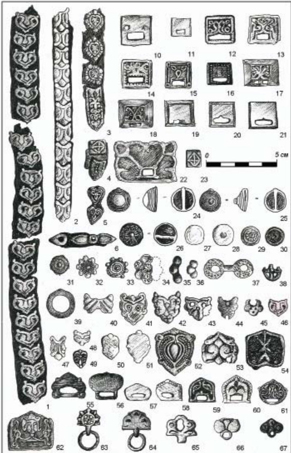
Рис. 1. Накладки Питерского (Степаново Плотбище) могильника.