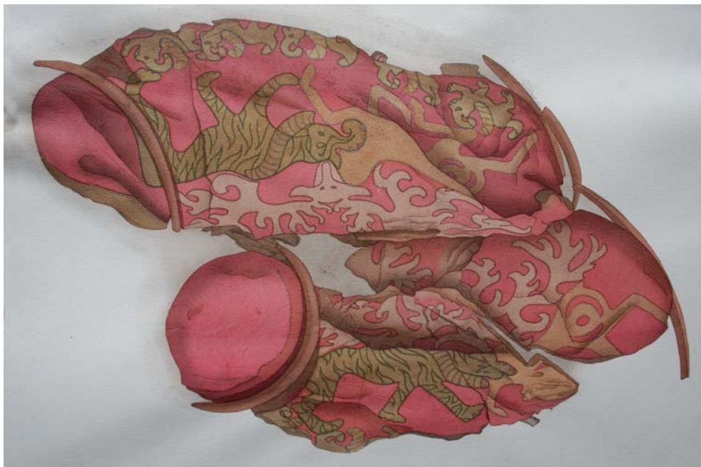
Рис. 2. Седло из кургана № 11 могильника Берел. Без масштаба (по: Самашев, 2011).