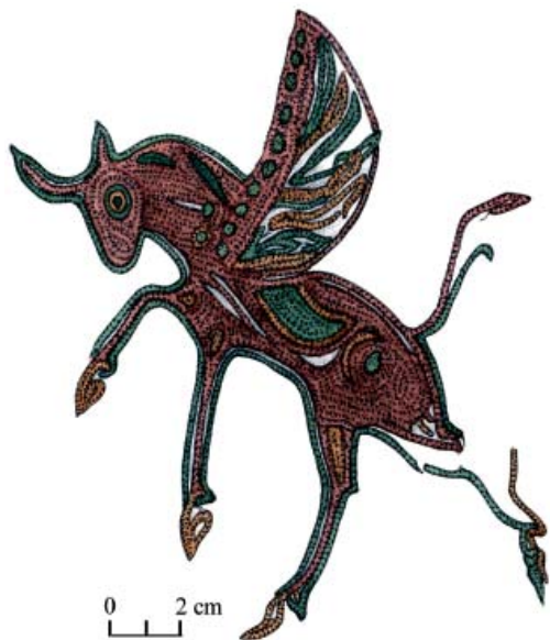
Рис. 3. Вышивка из кургана № 11 могильника Берел (по: Самашев, 2011).