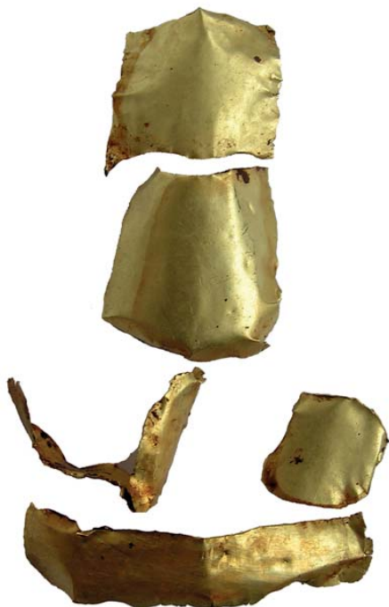
Рис. 3. Лицевое покрытие на нос и зубы, золото (п. 293, Кудашевский I могильник).

Fig. 3. Facial cover for nose and teeth, gold (grave 293. Kudash I burial ground).