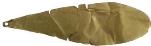
Рис. 1. Подвеска-покрытие, золото (п. 30, Красноярский I могильник).

Fig. 1. Pendant-cover, gold (grave 30, Krasnoyarsk I burial ground).