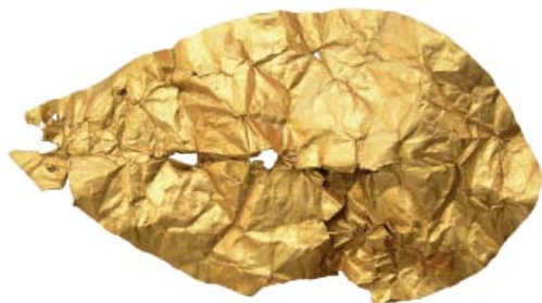
Рис. 2. Подвеска-покрытие, золото (п. 174, Кудашевский I могильник).