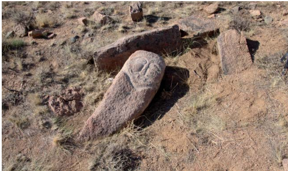
Рис. 3. Разрушенная тюркская ограда с изваянием в местности Теректы аулие.