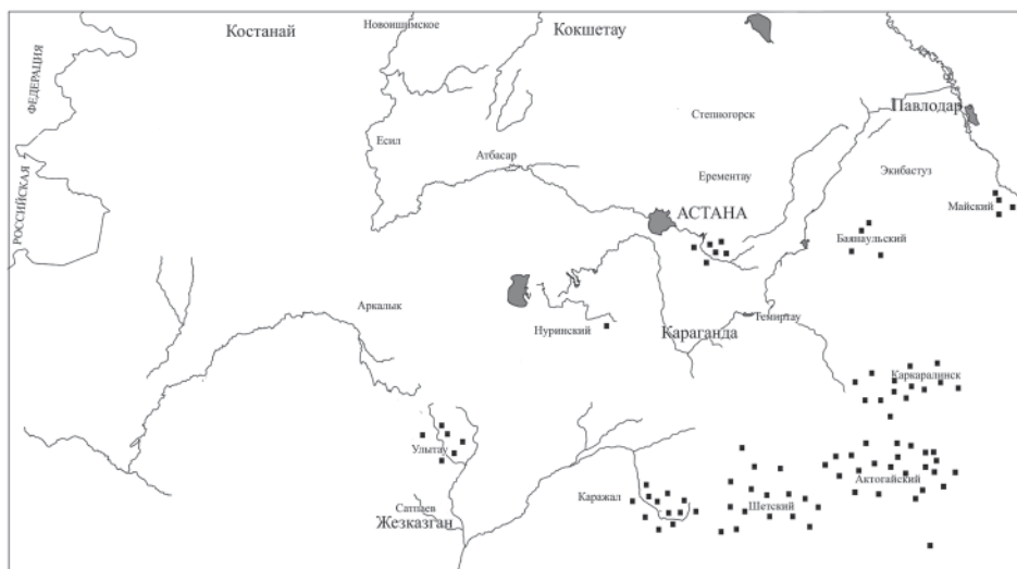
Рис. 2. Карта распространения кыпчакских изваяний в Сарыарке.