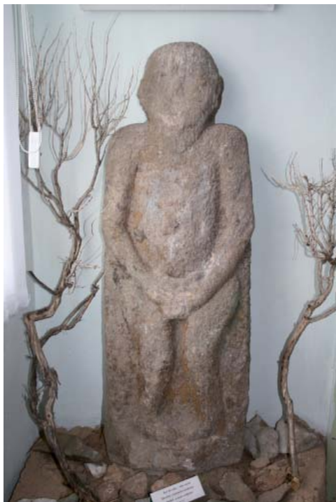
Рис. 5. Кыпчакское изваяние из урочища Кызылы.

Fig. 5. Kipchak statue from Kyzylly locale.