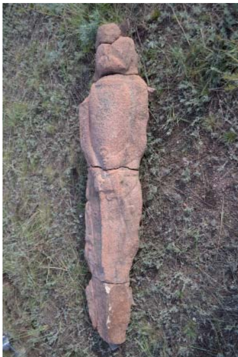
Рис. 6. Тюркское изваяние из урочища Борили.