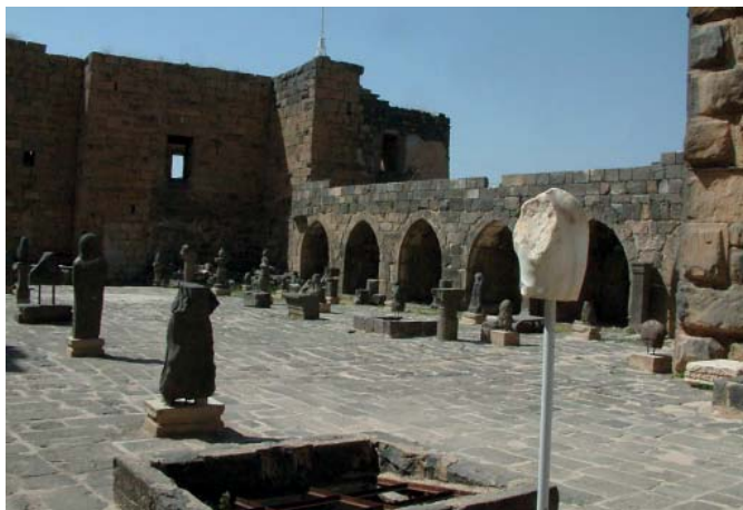
Рис. 8. Музей классических и исламских артефактов в археологических раскопках Босры. Fig. 8. Museum of Classical and Islamic Artifacts discovered at archaeological excavations of Bosra.

ное значение, например, монастырь несторианского монаха VII в. Бахиры, который, по преданию, в детском возрасте посетил пророк Мухаммед.