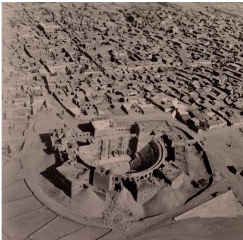
Рис. 2. Общий вид археологических раскопок Босры с воздуха.