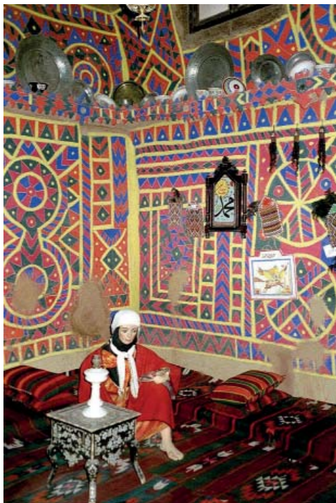
Рис. 6. Музей народных традиций в археологических раскопках Босры.