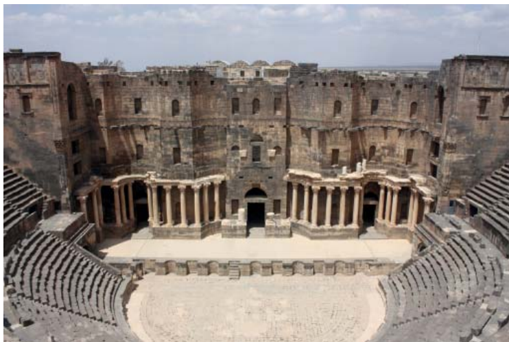
Рис. 4. Римский театр в археологических раскопках Босры.