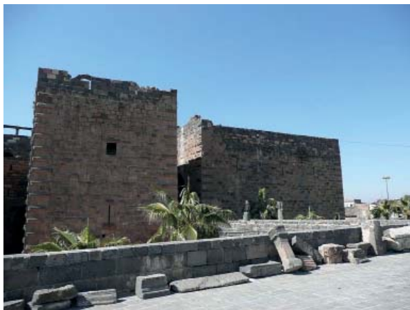
Рис. 7. Открытый музей в археологических раскопках Босры.

Fig. 7. Open-air museum at the archaeological excavations of Bosra.