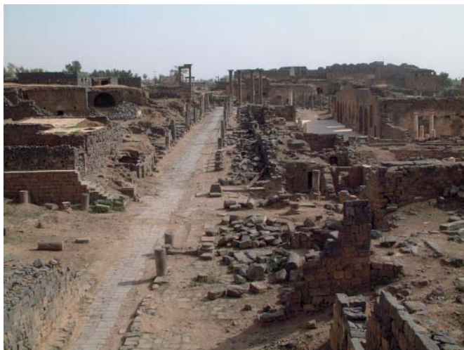
Рис. 3. Общий вид археологических памятников на месте Босры.