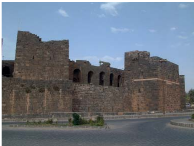
Рис. 5. Исламская крепость в археологических раскопках Босры.