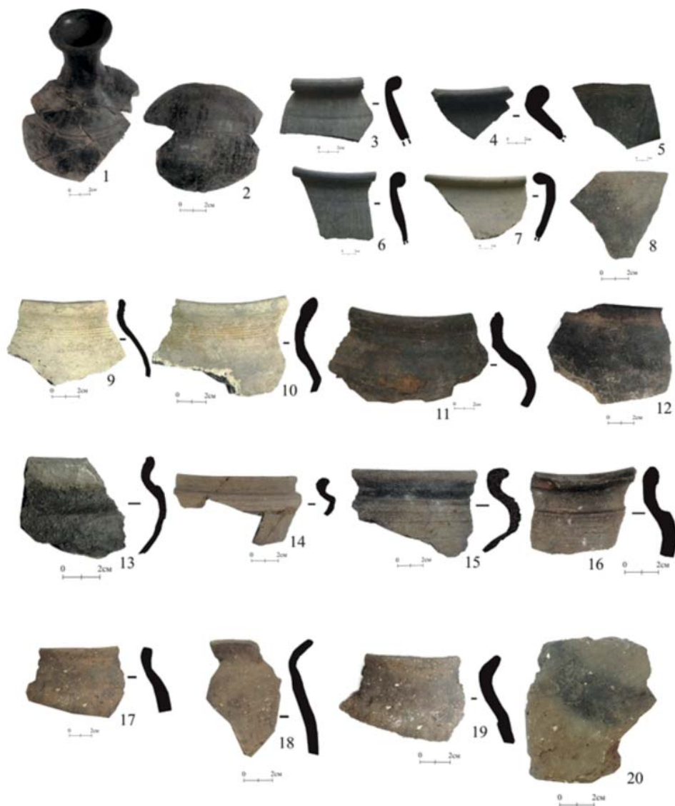
Рис. 2. Фрагменты русской керамики из раскопок Казанского Кремля.