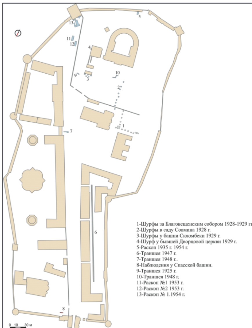
Рис. 3. Археологические исследования Н.Ф. Калинина на территории Казанского Кремля (по Ситдикову А.Г., 1999).