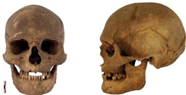
Рис. 2. Череп из могильника Красиково I.