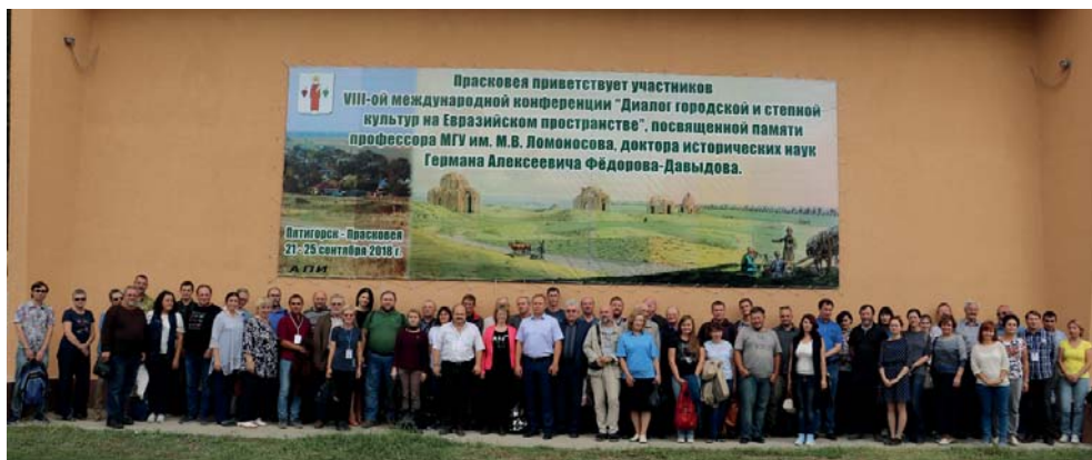
Рис. 1. Общее фото участников VIII Международной научной конференции посвященной памяти Г.А. Фёдорова-Давыдова «Диалог городской и степной культур на Евразийском пространстве». Прасковья, Ставропольский край, 25 сентября 2018 г.

Fig. 1. Photograph of the participants of the 8 th International Scientific Conference dedicated to the memory of G.A. Fedorov-Davydov “Dialogue of urban and steppe cultures in the Eurasian space”. Praskoveya, Stavropol Krai, September 25, 2018.