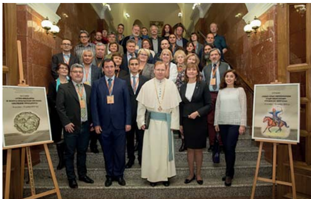
Рис. 2. Общее фото участников IV Международного Магьярского симпозиума. Казань, Республика Татарстан. 16 октября 2018 г.

Fig. 2. Photograph of the participants of the 4 th International Magyar Symposium. Kazan, Republic of Tatarstan. October 16, 2018