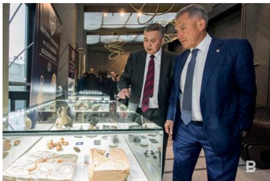
Рис. 11. Посещение Президентом Республики Татарстан Р.Н. Миннихановым временной выставки Института археологии им. А.Х. Халикова АН РТ.