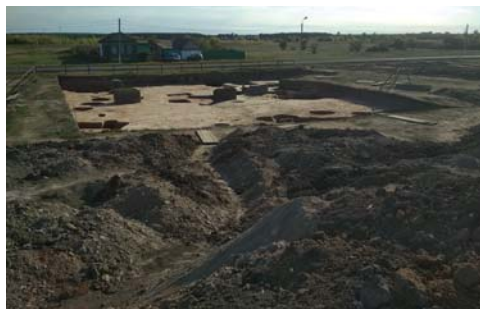
Рис. 5. Археологические исследования на Болгарском городище в 2018 г.

В 2018 г. были продолжены полевые археологические исследования на территории Болгарского городища и в его округе (12 раскопов) (рис. 5), Билярского городища (1 раскоп) (рис. 6) и на острове Свяжск и в его округе (10 раскопов) (рис. 7). Проведенные работы являются важной составляющей формирования целостной системы сохранения историко-культурного наследия и его эффективного использования, включения уникаль-