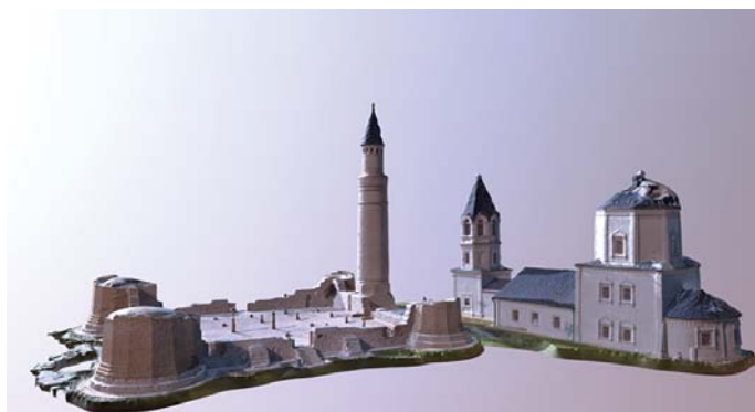
Fig. 12. Three-dimensional model of the Cathedral Mosque of Bolgar fortified settlement.