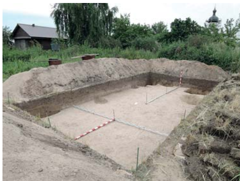
Рис. 7. Археологический раскоп на территории острова-града Свияжск.

Fig. 7. Archaeological excavation in the territory of the island-fort of Sviyazhsk.