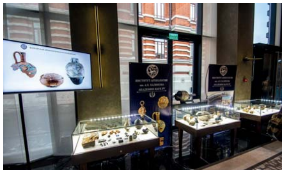
Fig. 10. Temporary exhibition of the Museum of Archaeology of the Republic of Tatarstan under the Institute of Archaeology of the Academy of Sciences.

Татарстана и не представлено в таком масштабе в их экспозициях. Поступления в Научный фонд составили 121 единицу хранения документов научного наследия по археологии, которые составят дополнение к Путеводителю по научному фонду Музея археологии РТ (Садриев, 2017, с. 202–204).