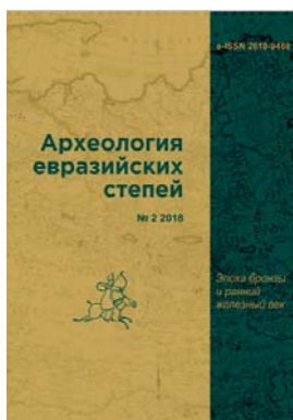
Fig. 9. Cover of the journal “Archaeology of the Eurasian Steppes”.

общим объемом 156,3 а.л., в том числе 30 статей сотрудников Института (Ситдииков, 2018, с. 6–7).