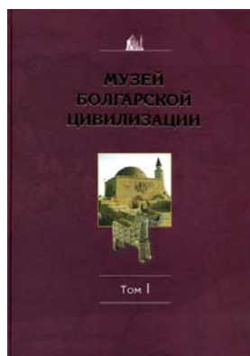
Fig. 4. Cover of the book “Museum of Bolgar Civilization / Ancient Bolgar: Life of the Town. Catalog”. Vol. 1.