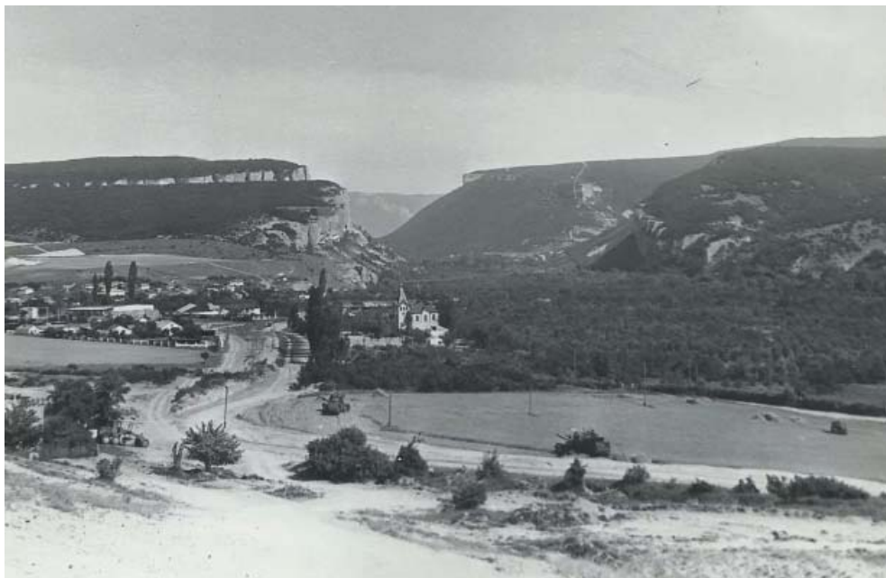
Рис. 3. Вид на с. Биюк-Сюрень. В центре – имение Н.А. Говорова (фото начало XX века).