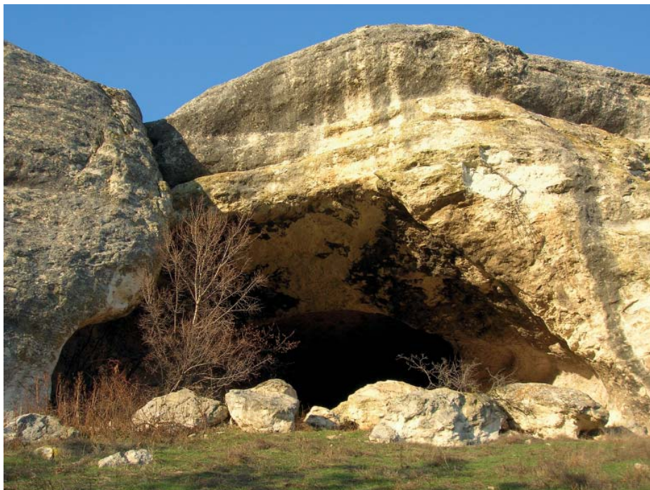
Рис. 7. Грот «Храма» у с. Кабази.