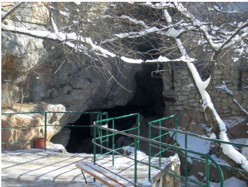
Рис. 8. Вход в пещеру Харанлых-Коба.