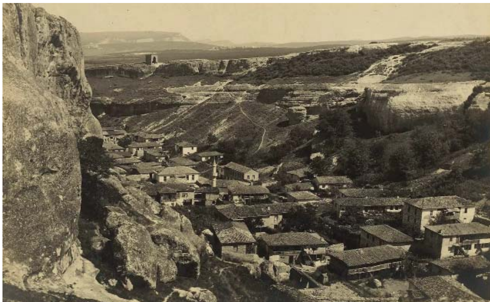
Рис. 9. Село Черкес-Кермен (фото начало XX века).