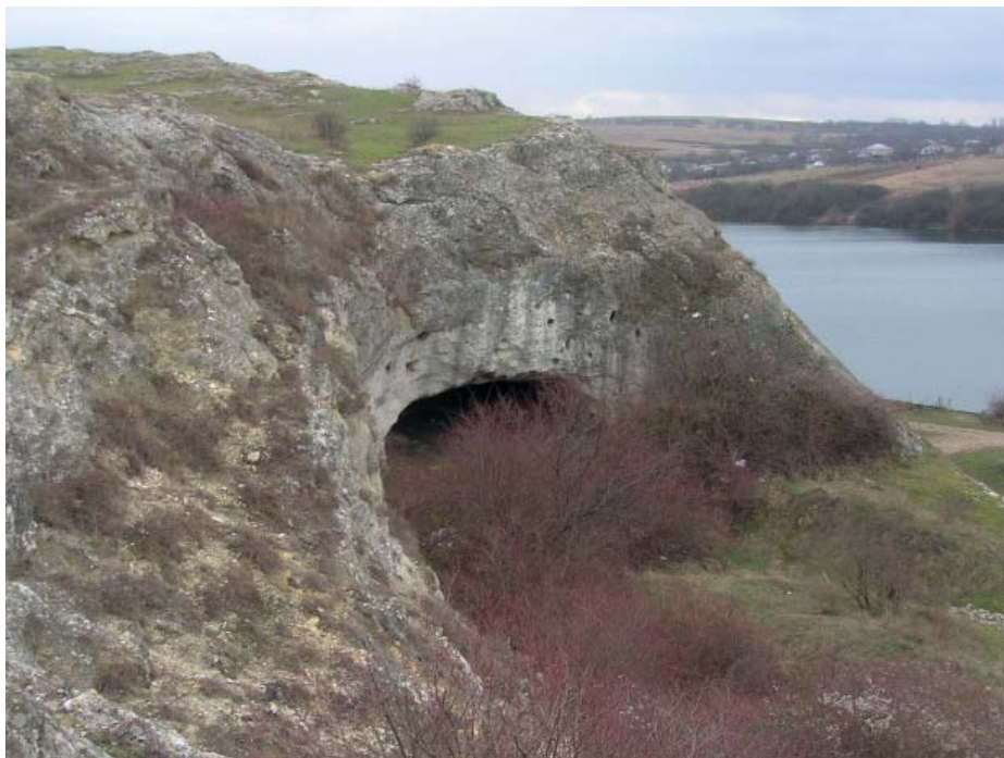
Рис. 6. Волчий грот.