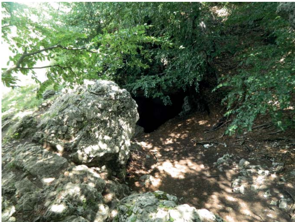
Рис. 5. Вход в пещеру Холодная на Чатырдаге.