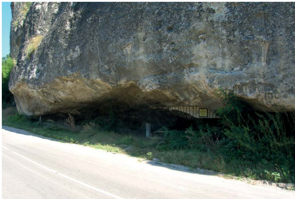
Рис. 4. Качинский навес.