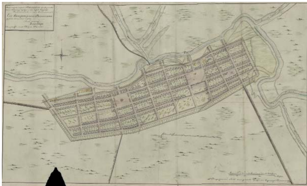
Рис. 4. План г. Спасска, копия с конформированного в 1822 г. (РГАДА. Ф.1356. Оп.1. Д.1334).

Fig. 4. Spassk town plan, a copy from the one in 1822. Russian State Archive of Ancient Documents, fund 1356, inv. 1, dossier 1334.