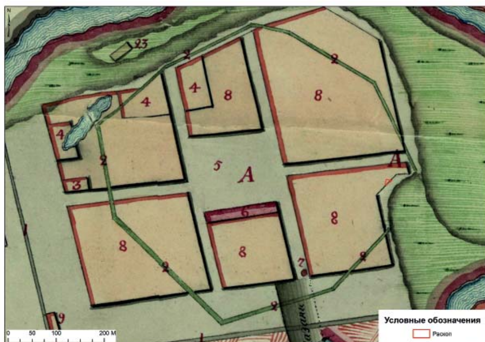
Рис. 7. Фрагмент плана г. Спасска конца XVIII в. с указанием раскопа I 2016 г.

Fig. 6. Spassk town plan dated 1862. National Archive of the Republic of Tatarstan, fund 324, inv. 739, dossier 102.