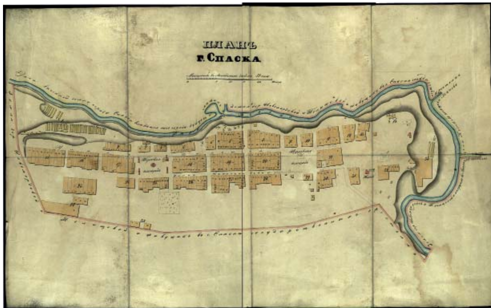
Рис. 6. План г. Спасска. 1862 г. (НА РТ. Ф.324. Оп.739. Д.102).

Fig. 6. Spassk town plan dated 1862. National Archive of the Republic of Tatarstan, fund 324, inv. 739, dossier 102.