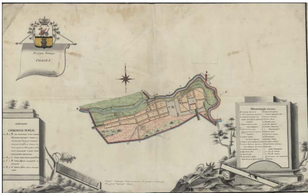
Рис. 2. План г. Спасска конца XVIII в. (РГАДА. Ф.1356. Оп.1. Д.1331.)