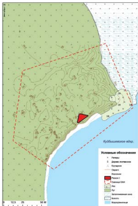
Рис. 1. Топоплан Старокуйбышевского VII селища.