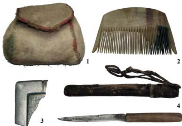
Рис. 4. Предметы быта из скального захоронения Узуур гялан.

скальных захоронений, демонстрирует целый ряд общих черт. Показательной характеристикой ряда объектов является наличие значительного количества предметов из органических материалов (ткань, дерево, кожа), что заметно выделяет эти комплексы (рис. 3). Однако, судя по всему, это следует связывать не столько с особыми традициями обрядовой практики, сколько с упомянутой выше прекрасной сохранностью комплексов благодаря условиям совершения захоронения. В этом плане более показательным представляется сходный состав инвентаря скальных погребений Арцат дэл, Балтарган, Жаргалант Хайрхан и Узун хая, в которых рядом с умершим воином находилось редкое клинковое оружие, полное снаряжение лошади, в большинстве случаев включавшее парадные украшения амуниции, лук со стрелами и др. Материалы раскопок данных комплексов позволяют говорить о существовании устойчивых наборов вещей, характерных для скальных захоронений мужчин. Вероятно, похожие традиции соблюдались и в отношении умерших женщин различного возраста. В данном случае обратим внимание на наличие редких фрагментов металли-