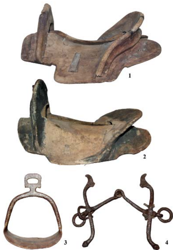
Рис. 2. Предметы конского снаряжения из скальных захоронений: 1 – Жаргалант Хайрхан; 2–4 – Арцат Дэл).