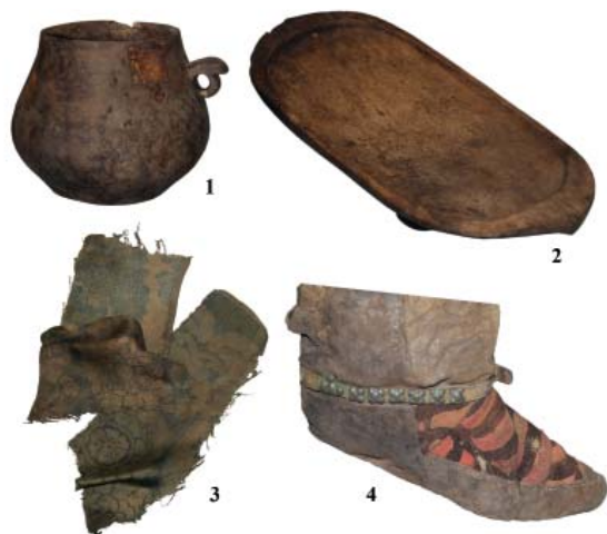
Рис. 3. Деревянная посуда и элементы костюма из скального захоронения Узуур гялан.